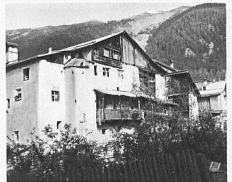
Santa Maria. Häuser an der Muranza