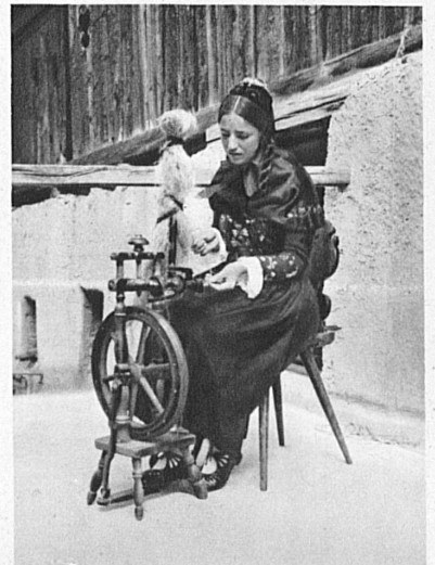
Handweberei Münstertal. Am Spinnrad. (Tracht engadinisch.)

« Lasse deine Neider neiden, deine Feinde lasse hassen! Was der gute Gott dir gönnt – niemand kann dir dieses nehmen. » (Hausspruch in Valcava.)