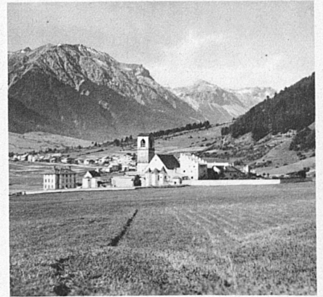
Kloster und Dorf Münster