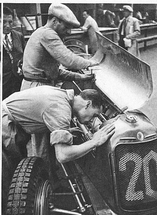
Dernier coup d'œil au moteur