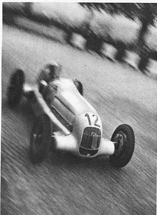
En pleine course