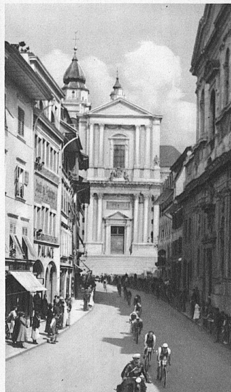
Traversée de Soleure

saisissante Axenstrasse, le Chemin Creux et l'arrivée triomphale à Lucerne.