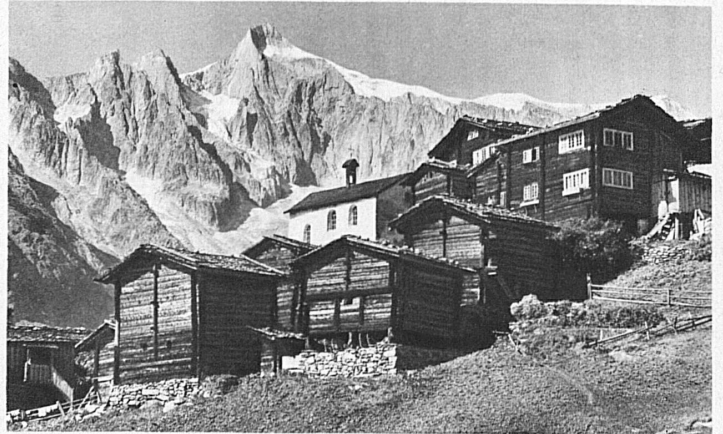
Ried, eines der kleinen, malerisch an den Hang geschmiegt Wal-liser Dörfchen