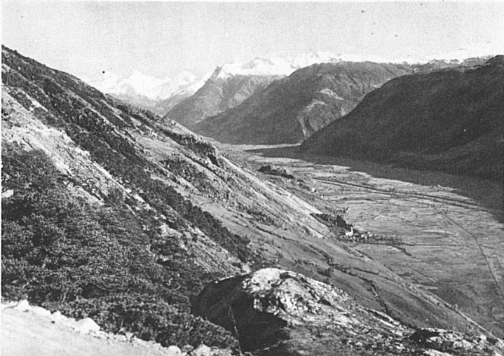
Blick von der Lötschbergbahn auf das Rhonetal gegen den Simplon