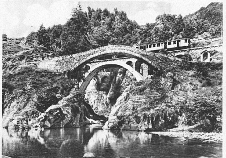
Im brückenreichen Tal der hundert Schluchten, im Centovalli