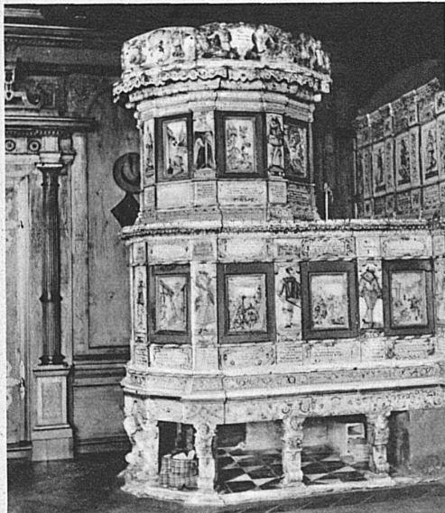
Bürgerratsstube in Chur. Bunt bemalter Turmofen von Hanns Heinrich Pfau in Winterthur 1632