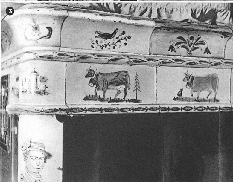
3 Detail eines Ofens aus der Werkstatt Löttscher (St. Antönien) in einem Haus in Pany. Anfang des 19. Jahrhunderts