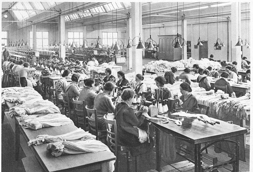
Arbeitsaal der Wirkerei-A.G. Uster (Kt. Zürich) « Elbeo » Strumpffabrik - Workroom in the Wirkerei A.G. Factory at Uster (Canton Zurich); « Elbeo » Stocking Factory

Die Schweiz ist arm an Bodenschätzen. Das zwingt dazu, die Spanne zwischen dem Preis des Materials und dem Preis des Fertigfabrikates auszudehnen durch Qualität und Unersetzbarkeit der Arbeit. Der Rohstoff muss in möglichst wertvolle Ware umgewandelt werden. In einer Zeit, die noch der modernen Transportmittel entbehrte, entfaltete sich schon im Rahmen geordneter Verhältnisse und im Schutz eines dauerhaften Friedens eine Reihe edelster Industrien. Als dann das Maschinenzeitalter und das Zeitalter des Verkehrs die Beschaffung des Rohstoffes für die Schwerindustrie erleichterten, war die geistige Konzentration, der praktisch-technische Sinn und das manuelle Geschick schon vorerworben, so dass es leicht gelang, mit Rohstoffländern selbst in Wettbewerb zu treten. Mit der Elektrizitätswirtschaft wurde die Wasserkraft, eine unvergleichliche, nie versiegende Energiequelle, der menschlichen Arbeit dienstbar gemacht. Die Gegenwart setzt den Entwicklungsmöglichkeiten enge Grenzen. Doch die schweizerische Industrie, der nie etwas in den Schoss gefallen ist, wird sich auch in dieser Lage bewähren.