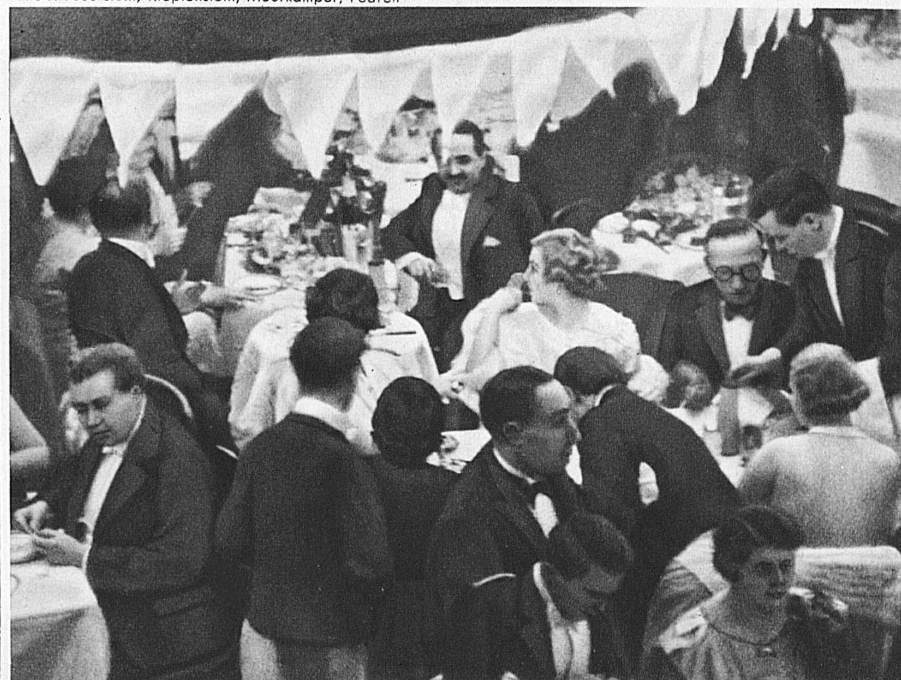
Soir à l'hôtel — Abend im Hotel