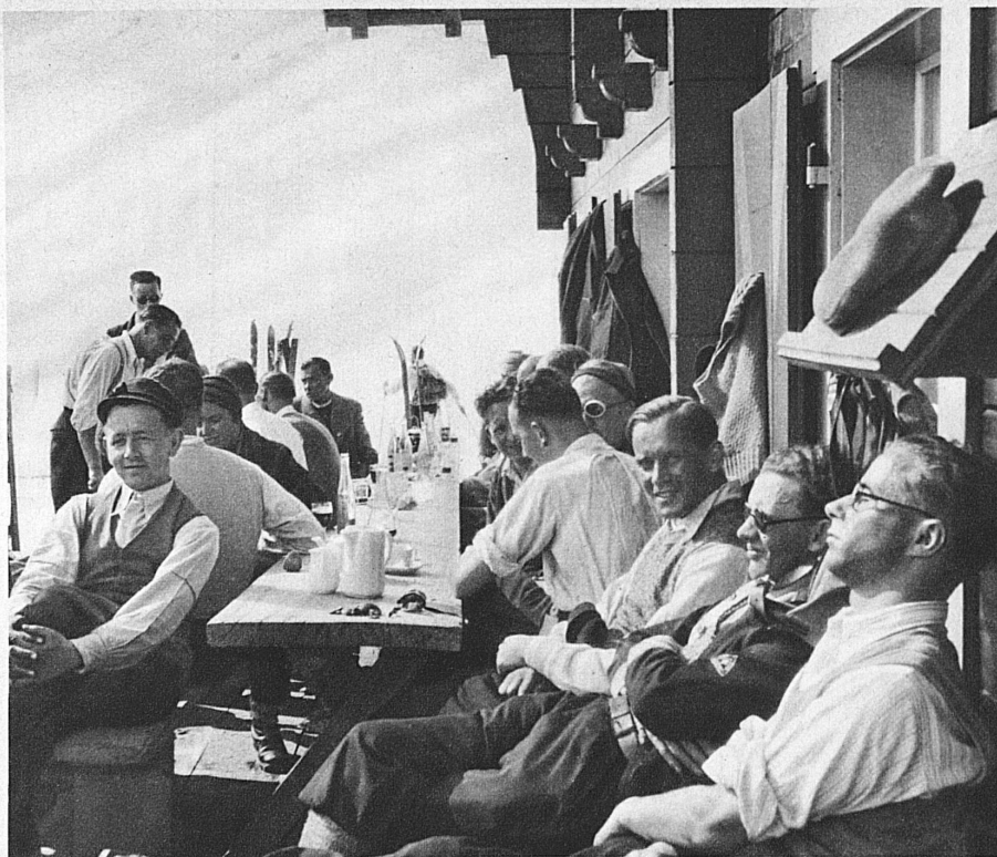
Des gaillards contents — Frohes Hüttenleben