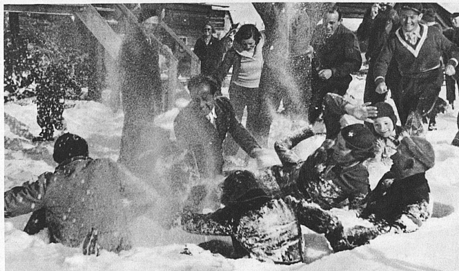
Escarmouche à l'arme blanche — Schneeballschlacht