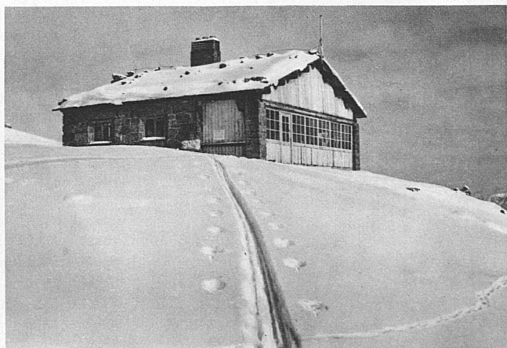
Cabane de Corviglia sur St-Moritz – Corvigliahütte bei St. Moritz