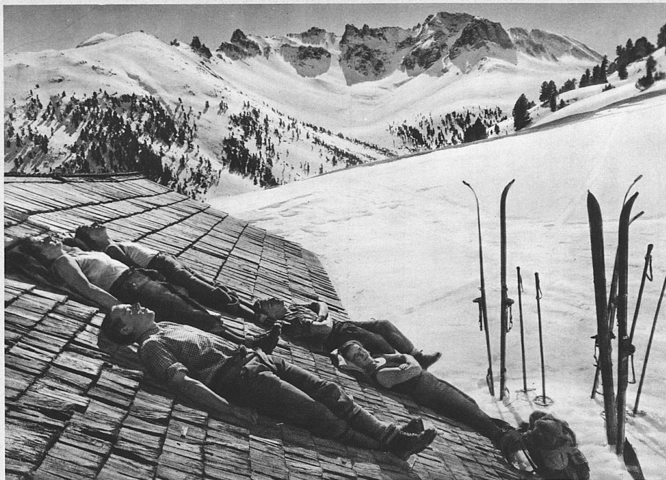
La sieste sur le toit (Basse-Engadine) – Siesta auf dem sonnigen Hüttendach