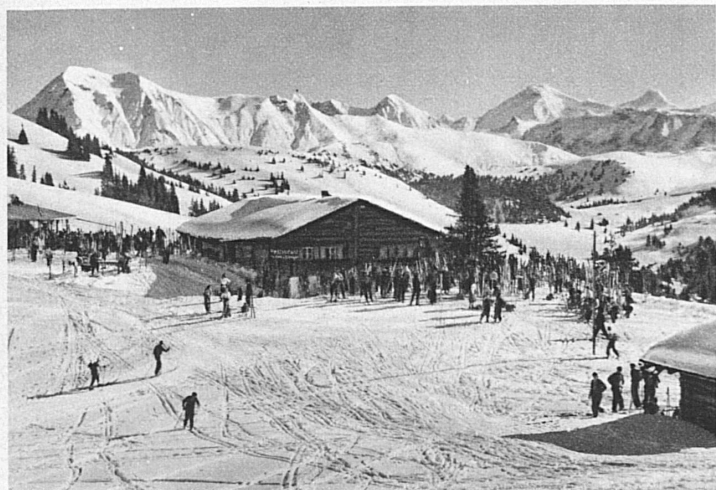
Au Hornberg (Montreux-Oberland bernois) – Hornberg ob Saanenmöser

nique de la construction en montagne, et à l'initiative des clubs locaux et des sociétés de développement, ont abouti à l'édification de ces magnifiques cabanes modernes qui, pour le confort, n'ont rien à envier à nos maisons d'habitation. Certaines sont de vrais petits hôtels, où des tenanciers affables tiennent auberge pour les voyageurs les plus exigeants. On en trouve jusqu'à trois mille mètres; telle la Diavolezzahütte que le skieur atteint en moins de trois heures, et d'où il gagnera la station de Morteratsch après une incomparable course de glacier. Moins ambitieux, il trouvera à 2500 m la Bovalhütte, cabane du C. A. S. au-dessus du glacier de Morteratsch, d'où il rejoindra la piste de descente de la Diavolezza au pied de la fameuse Isla Persa. Comme type de cabane récent, on peut mentionner la cabane de Moiry, au fond du val de Moiry près du Grand Cornier, et celle du Trient. Celles-ci sont en pierre, et leur maçonnerie affecte