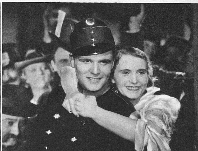
Alb. Lieven und Karin Hardt — Karl und Hermine