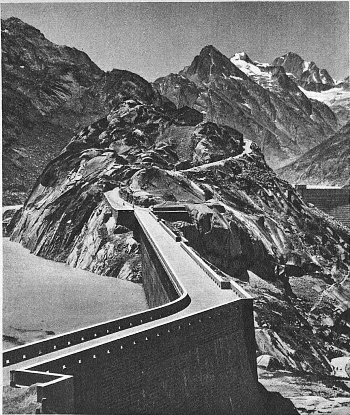
Ist dies ein Stück der chinesischen Mauer? Nein, die Grimsel-Seeferegg Une vue de la grande muraille de Chine? Non, tout simplement le barrage Grimsel-Seeferegg