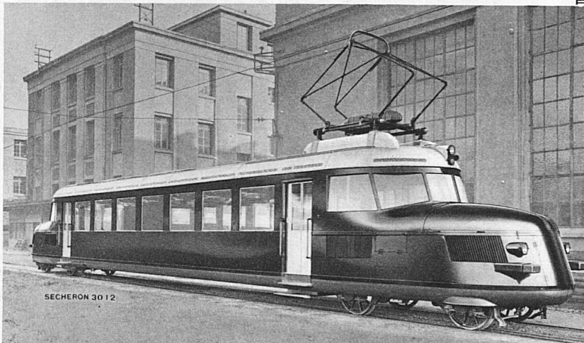
Automotrice électrique rapide pour les CFF: Appareillage Electrique de la S. A. des Ateliers de Sécheron.

Traction électrique Transformateurs Machines électriques