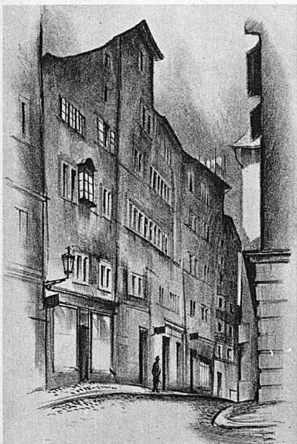
Das Haus «Zum Rothen Gatter» in Zürich