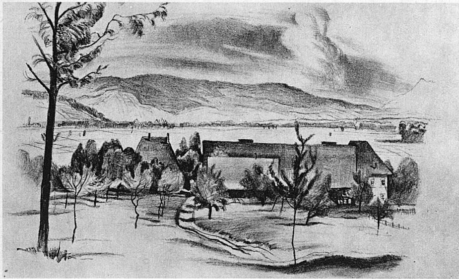
Der Neuhof bei Birr in seiner heutigen Gestalt. Rechts im Bild das Wohnhaus Pestalozzis

Es ist die Grabschrift Pestalozzis am Schulhaus Birr. Wenn eine Grabschrift bei allem Lob nicht schmeichelt, so ist es diese. Die Stätten von Pestalozzis Leben und Wirken sind Stationen im biblischen Sinn. Keiner seiner Unternehmungen war Dauer und Erfolg beschieden, jede Epoche seines Lebens steht — wie einer seiner besten Kenner gesteht — auf den Trümmern einer frühern.