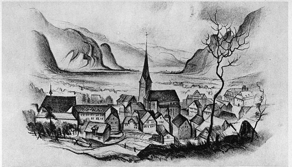
Stans mit dem Kapuzinerkloster. Blick auf den Vierwaldstättersee