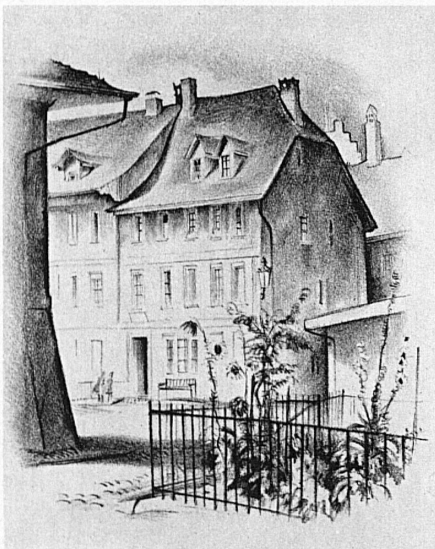
Die ehemalige Hintersässenschule in Burgdorf

materiellen Sorge enthoben. Noch einmal erwacht sein alter Wunsch: in C l i n d y gründet er für die ärmsten der Kinder eine Armenanstalt, die jedoch schon im folgenden Jahre 1819 mit Iferten vereinigt wird. Endlich scheint der Traum seines Lebens Wirklichkeit zu werden, als unter seinen Lieblingslehrern ein Streit ausbricht, der alles in Frage stellt. Mehr und mehr entgleiten seinen zitternden Händen die Zügel: in seinem achtzigsten Jahre kehrt er zu Enkel Gottlieb auf den «Neuhof» zurück, durchirrt wieder wie in frühern Tagen das endlose Birrfeld, erlebt noch einmal das Glück, dass ihn die Neuhelvetische Gesellschaft unter ungeheurem Jubel zu ihrem Präsidenten ernannt. Da erscheint jene bekannte Schmähschrift Bibers, die Pestalozzis Kräfte brach. Am 17. Februar 1827 hat ihn in Brugg der Tod ereilt. Seine geistigen und sittlichen Kräfte aber lebten lange fort und leben heute nach. Unter den Talenten des Verwaltens und Bewahrens ist er einer der wenigen Genien, die die verwaisten Täler der Welt mit der Allmacht der Liebe und des schenkenden Willens füllten.