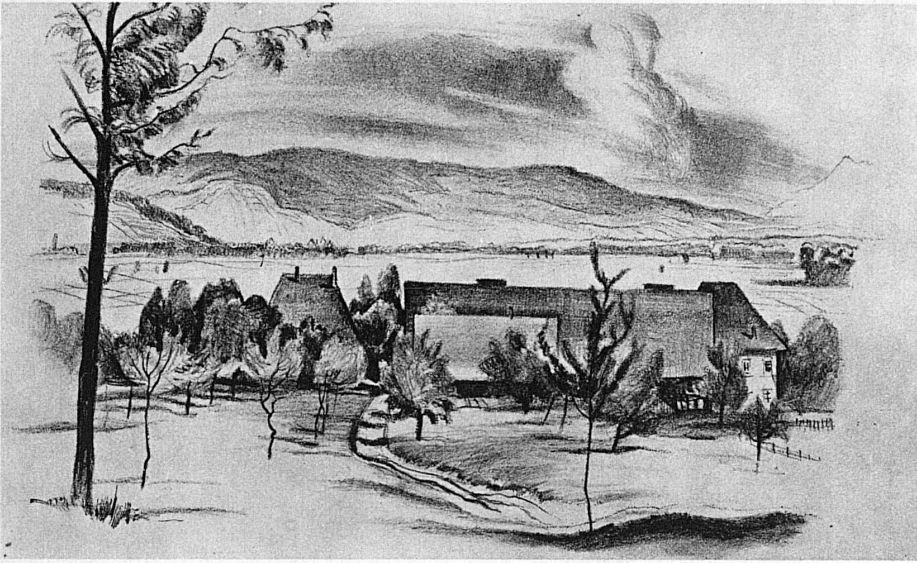
Der Neuhof bei Birr in seiner heutigen Gestalt. Rechts im Bild das Wohnhaus Pestalozzis

Es ist die Grabschrift Pestalozzis am Schulhaus Birr. Wenn eine Grabschrift bei allem Lob nicht schmeichelt, so ist es diese. Die Stätten von Pestalozzis Leben und Wirken sind Stationen im biblischen Sinn. Keiner seiner Unternehmungen war Dauer und Erfolg beschieden, jede Epoche seines Lebens steht — wie einer seiner besten Kenner gesteht — auf den Trümmern einer frühern.