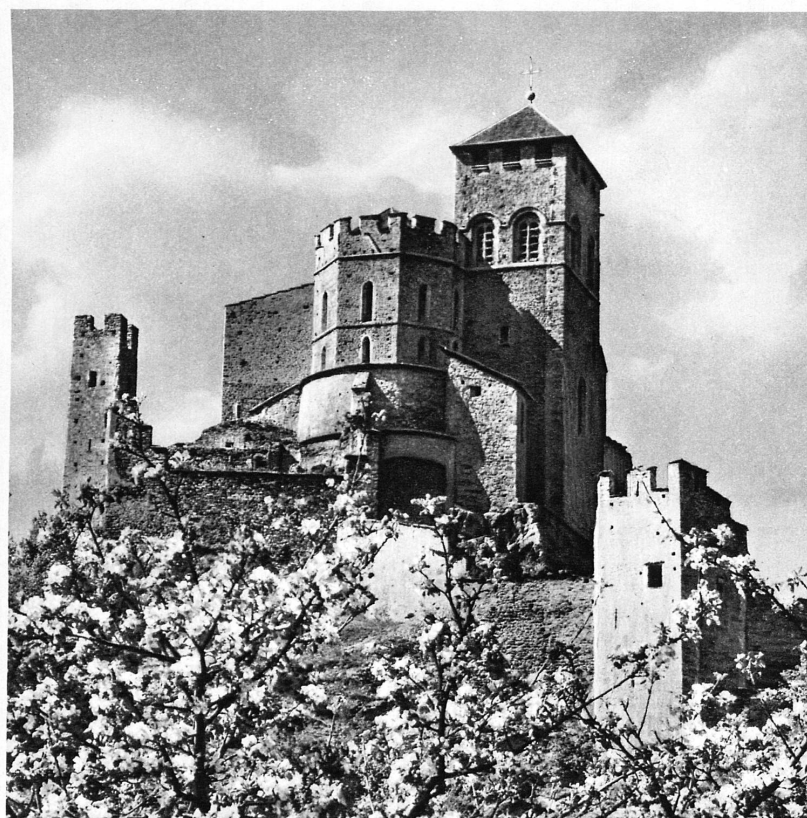
Die Burgkirche Valère in Sitten – L'église fortifiée de Valère à Sion