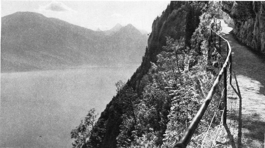
Der Felsenweg auf den Bürgenstock mit der Aussicht auf den See und den Rigi – Sentier dans le roc au Burgenstock avec la vue du lac et du Rigi