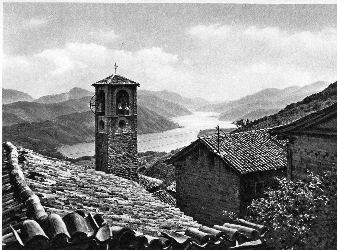
Cademario mit dem schönen Blick auf den westlichen Arm des Luganersees – Cademario et la vue du lac de Lugano