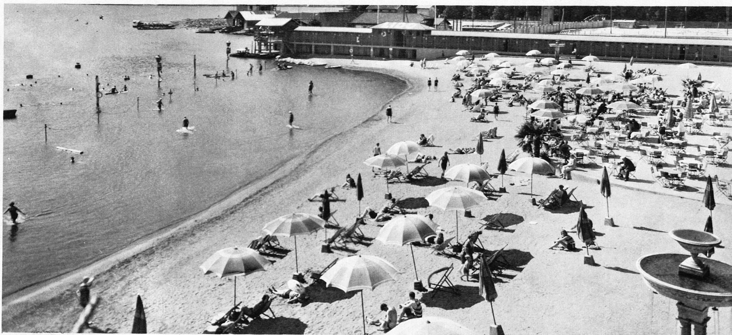
Am 15. April wird das Strandbad Lugano Lido eröffnet – La plage du Lido à Lugano s'ouvrira le 15 avril

Auch Schweizerferien sind heute kein Luxus mehr. Die Anpassung der schweizerischen Hotellerie ist vollzogen. Mit der Eroberung des Winters begann die Offensive der Billigkeit: Von 50 Franken an gab es 7 Tage Winterferien « alles inbegriffen » in einem guten Hotel. Wochenendarrangements konnten in der letzten Saison getroffen werden von 12 und 20 Franken an.