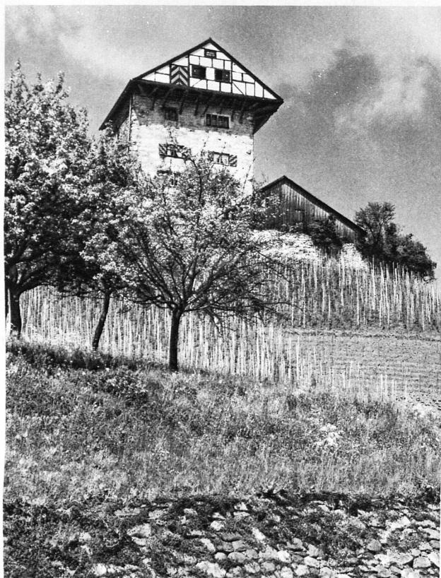
Schloss Lüchingen an der Linie Altstätten - Gais – Château de Lüchingen sur la ligne Altstätten - Gais