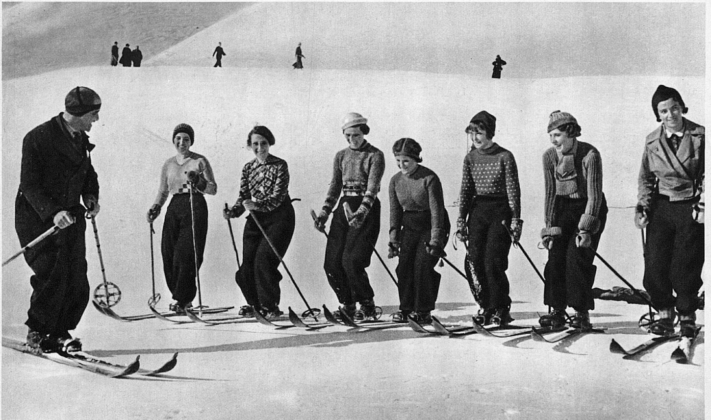
A l'Ecole suisse de ski. La souplesse des genoux fait tout – In der Skischule. Bewegliche Knie sind die Hauptsache

Les choses ont passablement changé depuis là. Ces messieurs et dames du promenoir ont à peu près disparu, c'est-à-dire qu'ils sont là mieux que jamais, mais qu'ils ont quitté les petits chemins battus, la tenue de garden-party, et que chaussés maintenant d'hickory, vêtus à l'ordonnance bleu sombre, spahis bouffants et casquette militaire, qui compose présentement l'uniforme de la marine mixte des neiges, ils sont partis à la conquête des stemms, des christ, des télé, et des