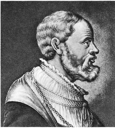
Bürgermeister Rudolf Brun, der in Zürich 1336 die Zunftverfassung einführte