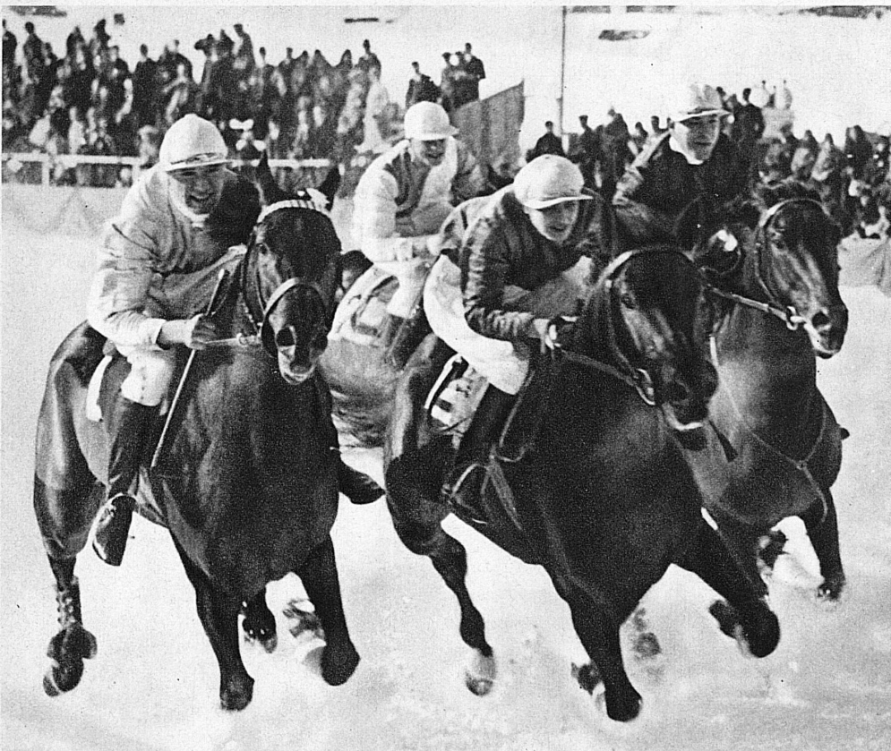
Sur le turf blanc de St-Moritz - Flachrennen auf dem St. Moritzersee

Kandersteg. Curling. L'hôtelier, dont c'est le tour de solder les gin fizz, lâche négligemment: « J'ai ce matin vingt millions sur la glace. » Ce doit être, en effet, la surface fiscale que composent ensemble les six gentlemen à carreaux qu'on aperçoit d'ici agitant leurs balais à curling. La glace, il faut en convenir, vaudrait à elle seule cette somme.