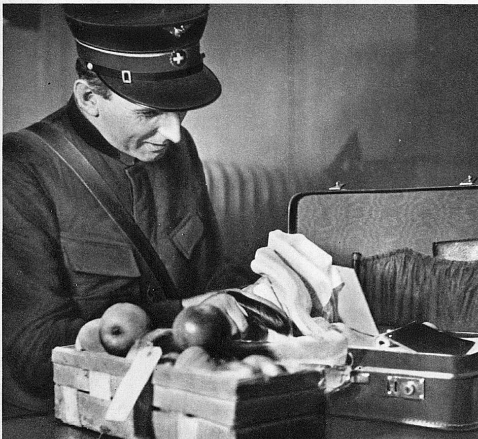
Was der Kondukteur beim Durchgehen des Wagens fand — Un contrôleur qui a la main heureuse

Und so wandern die gehäuften Bestände aus dem Zürcher Zentral-Fundmagazin zweimal im Jahr ins Auktionslokal, wo sie unter den Hammer kommen. 80,000 Gegenstände — ein Fundobjekt setzt sich ja mitunter aus verschie- denen Sachen zusammen — sind es durch- schnittlich in einem Jahre, und bei der letzten Gant wurden — neben 1400 Schirmen und 350 Bergstöcken — Mäntel, Hüte, Mützen und Handschuhe zentnerweise versteigert, von dem sonstigen geballten Trödel ganz zu schweigen. Der Erlös wird der Pensions- und Hilfskasse des Eisenbahnpersonals überwiesen — der gleich- gültige Verlierer soll wenigstens wissen, dass der Ertrag aus seiner Vergesslichkeit keinem gleichgültigen Zwecke zugute kommt. E. G.