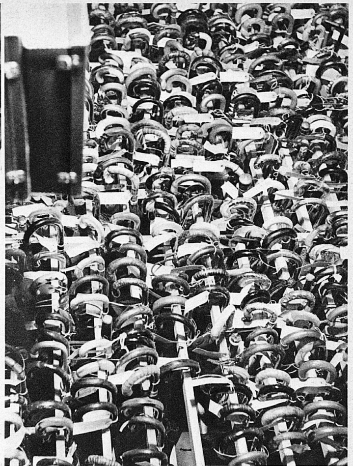
Bis zu 1500 Schirmen häufen sich im Laufe eines halben Jahres im Zürcher Zentral-Fundmagazin an. Jeder trägt seinen eigenen Steckbrief: Fundort und Fundzeit — En six mois 1500 parapluies s'entassent aux objets trouvés, chacun avec sa fiche mentionnant le lieu et le jour de la prise

Was aber geschieht, wenn der Verlierer dem Fundbureau nicht den Gefallen tut, sich freiwillig zu melden? Da bleibt nichts übrig, als — ähnlich wie es der Kriminalist tut — Indizien nachzuspüren. Vielleicht findet sich in dem Photoalbum oder der silbernen Zigarettendose ein Hinweis zur Identifizierung des Besitzers, vielleicht hat jemand — nach