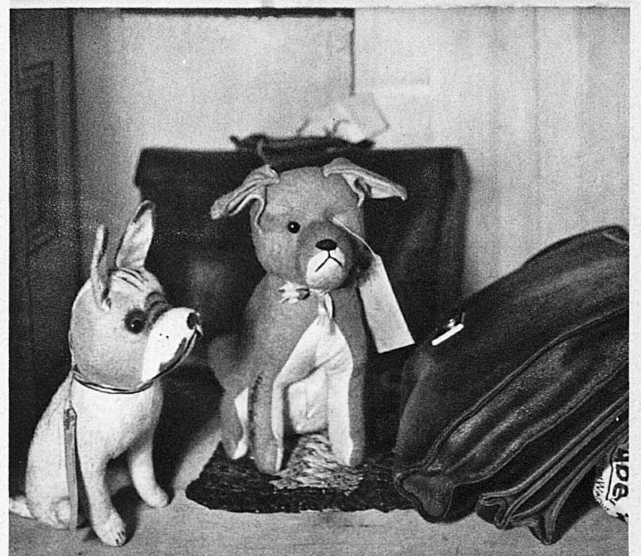
Stilleben aus dem Wandkasten des Fundbureaus: Der Ertrag eines Vormittags — Dans le placard des objets trouvés: la récolte d'une