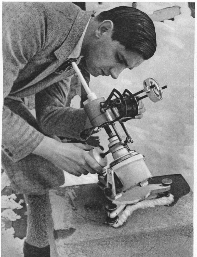
Dieser Apparat registriert automatisch die Sonnenscheindauer, indem die durch eine Linse gesammelten Sonnenstrahlen eine Brenns spur auf eine Walze schreiben - Cet appareil enregistre automatiquement l'insolation du fait que les rayons solaires, concentrés dans une lentille, sont enregistrés par une trace carbonée sur un tambour