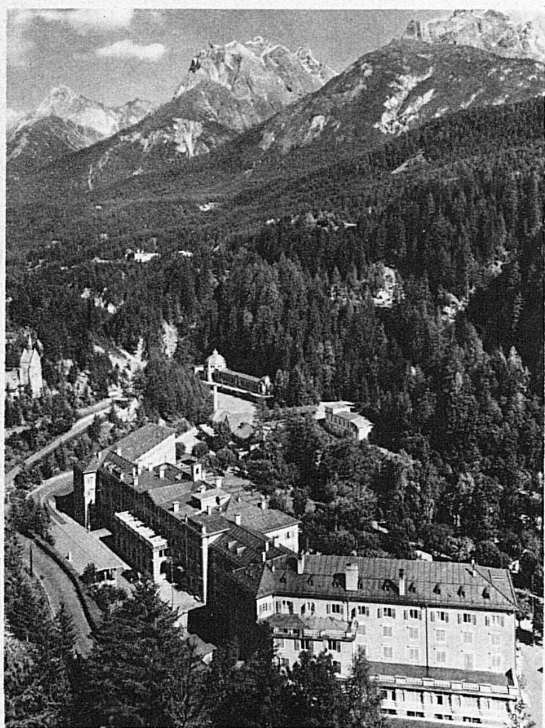
Le Kurhaus et les établissements de bains à Tarasp