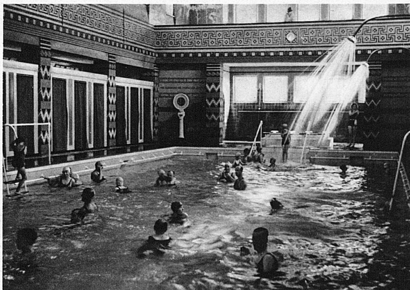
Thermal-Schwimmbad Ragaz — La piscine thermale à Ragaz