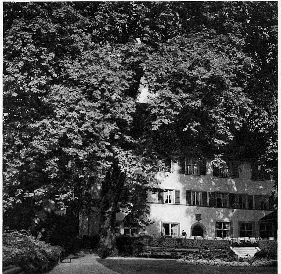
Brestenberg im prächtigen Schlosspark — Brestenberg-Les-Bains

Brestenberg , einst Lustschloss der Grafen von Hallwil, liegt nicht fern am kleinen Hallwilersee, nah dem grossen Vierwaldstättersee und nah den Bergen. Neben der eisenhaltigen Trinkquelle stehen ihm alle Kurhilfsmittel reichlich zu Gebote und, was Gesunde, Erholungsuchende rein entzücken wird, das Seebad in der lärmentrückten, unberührten Hügellandschaft.