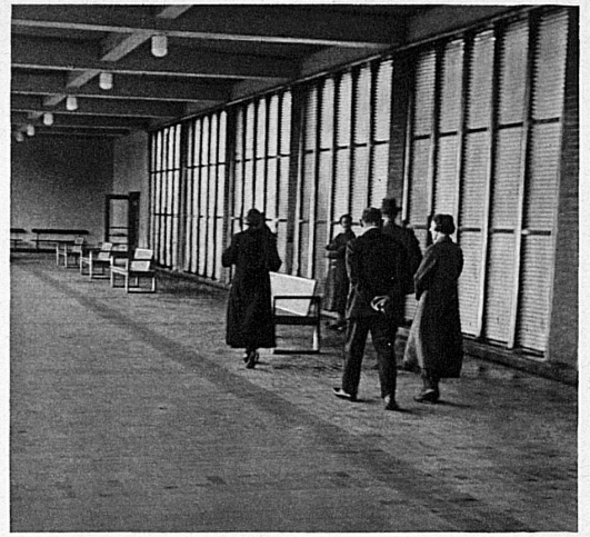
Die „Gradierwand“ in Rheinfelden — Où l'on respire l'air de la mer