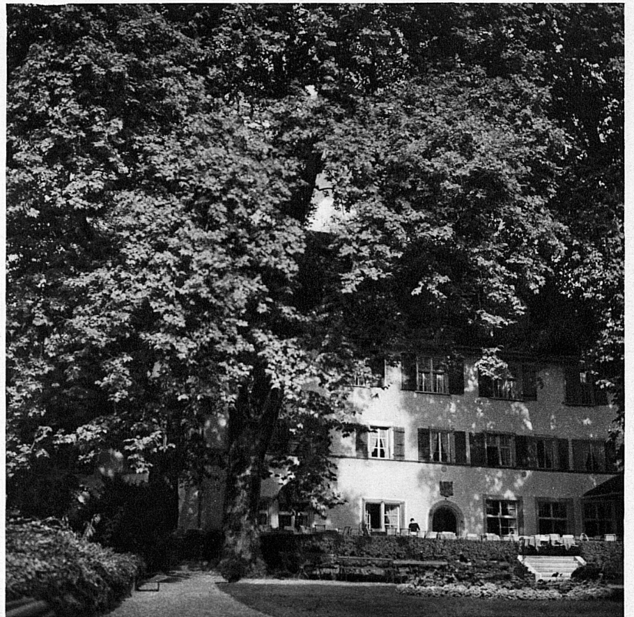
Brestenberg im prächtigen Schlosspark — Brestenberg-Les-Bains

Brestenberg , einst Lustschloss der Grafen von Hallwil, liegt nicht fern am kleinen Hallwilersee, nah dem grossen Vierwaldstättersee und nah den Bergen. Neben der eisenhaltigen Trinkquelle stehen ihm alle Kurhilfsmittel reichlich zu Gebote und, was Gesunde, Erholungsuchende rein entzücken wird, das Seebad in der lärmentrückten, unberührten Hügellandschaft.