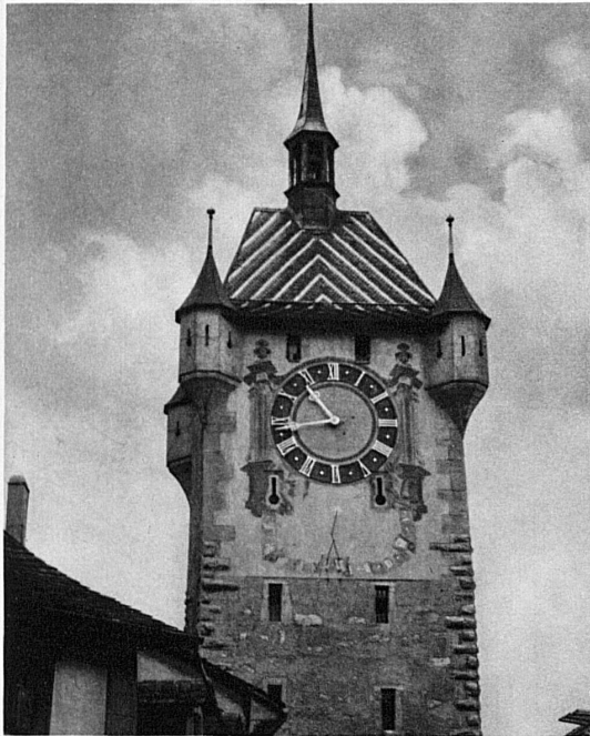
Alter Stadtturm in Baden — Ancienne tour à Baden