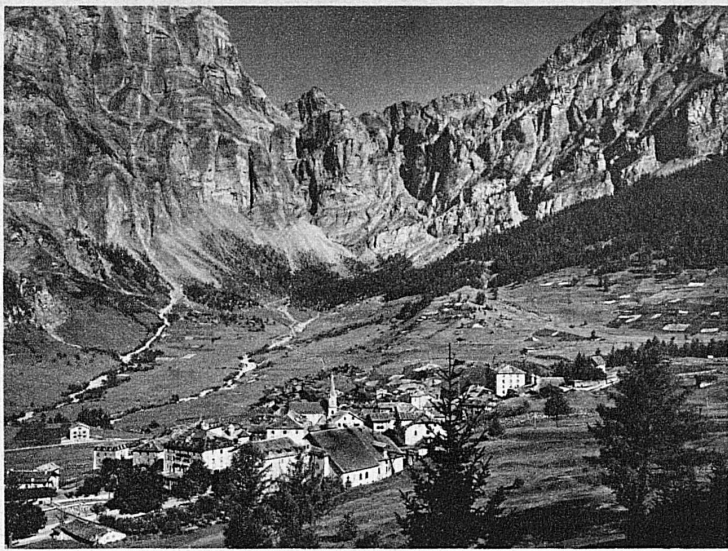
Leukerbäd im Wallis – Loèche-les-Bains