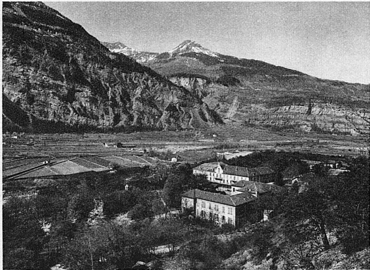
Lavey-les-Bains im Rhonetal (Vallée du Rhône)