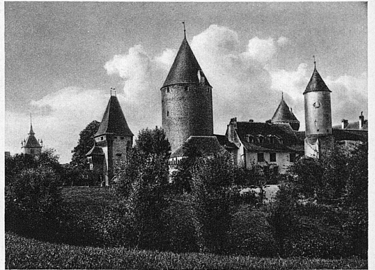
Das stolze Schloss Estavayer unweit von Bad Yverdon – Le château d'Estavayer non loin d'Yverdon-les-Bains sur le lac de Neuchâtel

La durée moyenne des bains est d'une demi-heure. A Loèche on la pousse avec d'excellents effets jusqu'à 3 et 5 heures. Ces eaux de Loèche sont connues depuis des siècles, bien avant que la station devint le rendez-vous des skieurs et des alpinistes. Un train à crémaillère relie à la ligne du Simplon cette élégante villégiature, qu'on s'étonne de trouver dans l'un des plus sauvages et grandioses décors du Valais.