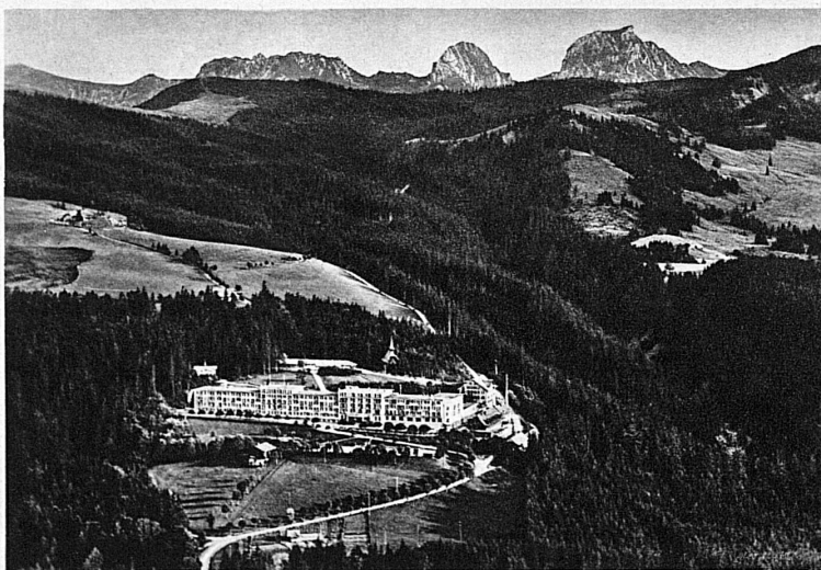
Gurnigelbad, Gantrisch und Nünenen – Gurnigel-les-Bains

Ueber dem flachen Tal der Gürbe und dem hügeligen Schwarzenburger Hinterland wölbt sich wie ein dunkel besticktes Kissen der tannenwaldblaue Gurnigel, die behagliche Vorstufe zu den Felsgipfeln der Stockhornkette. Die altbekannten Schwefel- und Eisenquellen des Gurnigelbades entspringen an der Flanke dieser waldwürrigen, von herrlichen Spazierwegen kreuz und quer überzogenen Kuppe. Die Trink- und Badekur ist hier mit dem ruhevollen Aufenthalt in der rauschenden Märchenlandschaft ausgedehnter Wälder verbunden.