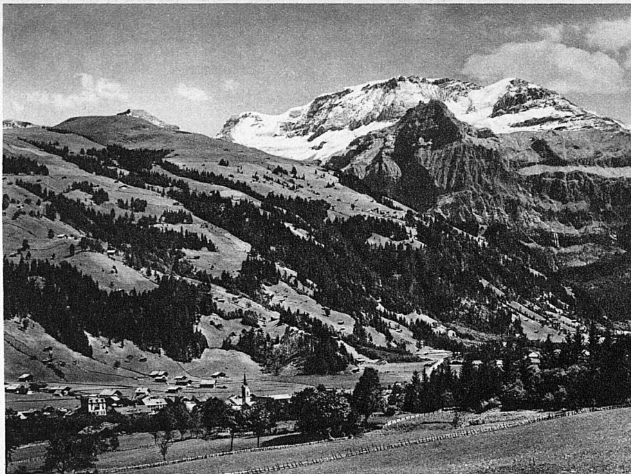
Lenk im Obersimmental und der Wildstrubel – Lenk (Simmental) et le Wildstrubel

Alpweidenland und Vorgebirge, nahe den höchsten Ewig-Schnee-Bergen: das ist das Simmental. Keine beschwerliche Tour, den Grat der Stockhornkette zu erreichen und gegen Norden das Hügelland, den Jura, die Vogesen, gegen Süden aber die Berner, Walliser und Urschweizer Hochalpen in einem freien Rundblick zu erfassen.