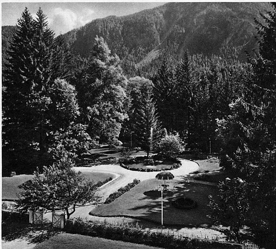
Der Park von Bad Alvaneu – Le parc d'Alvaneu-les-Bains