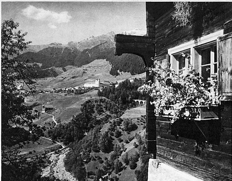
Disentis. Das Benediktinerkloster – Le cloître des Bénédictins

Acquarossa, dans la vallée de Blenio, est la seule station balnéaire du Tessin. Elle doit son nom « d'eau rouge » à sa source lithinée ferrugineuse arsénicale. De Biasca, sur la ligne du Gothard, un chemin de fer électrique y conduit en 40 minutes. Cette station, au centre d'un parc méridional, joint le pittoresque de ses villages à campaniles à la végétation luxuriante du Tessin.