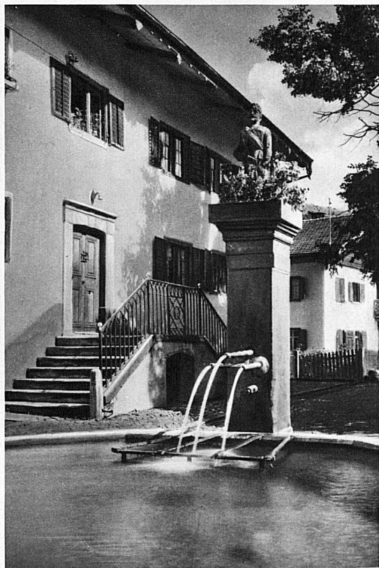
Der Dorfbrunnen in Fideris – La fontaine du village à Fideris