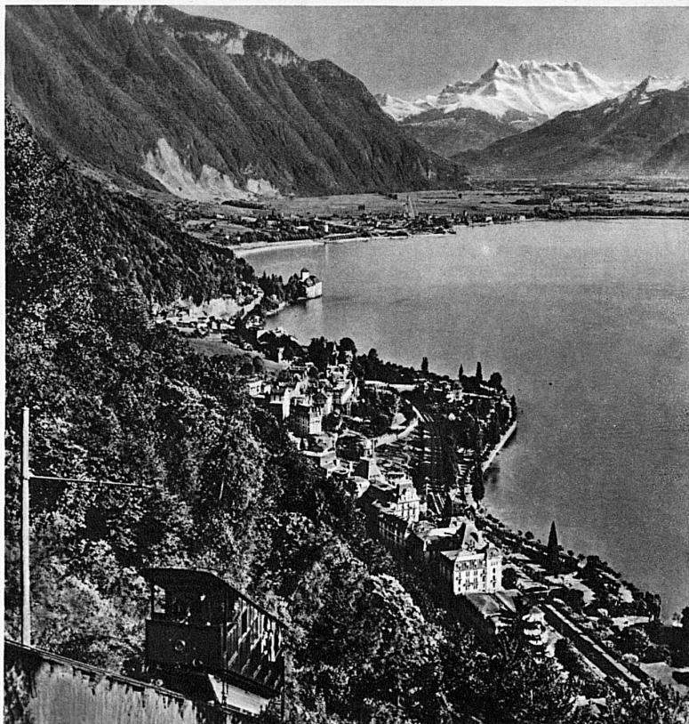
Montreux und die Dents du Midi – Montreux et les Dents du Midi

Des Solothurner. Schützenfestes im August, das mit der Jahrhundertfeier des kantonalen Schützenvereins verbunden ist, werden wir in der Julinummer unserer Zeitschrift gedenken.