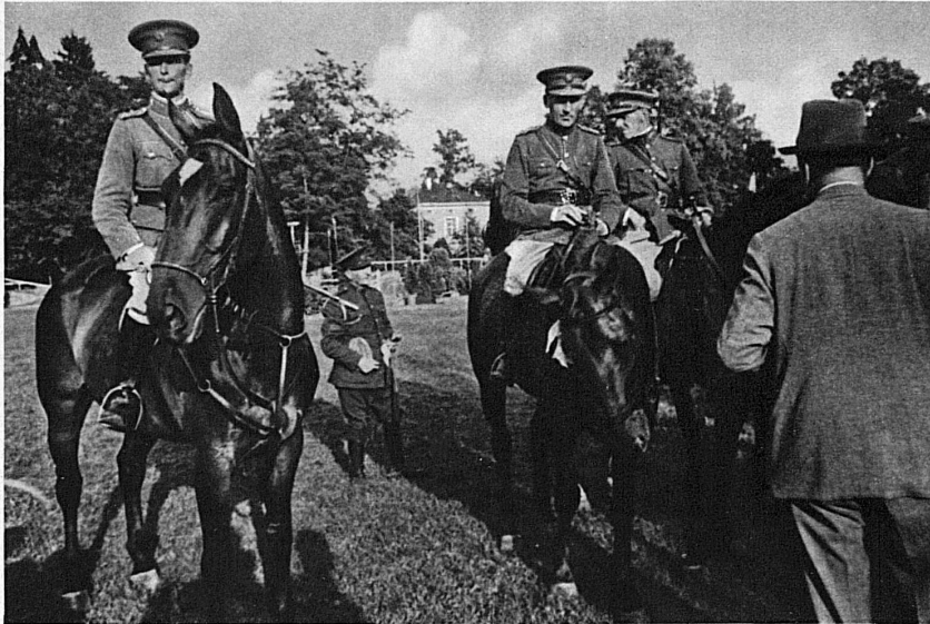
Bilder vom Internationalen Luzerner Concours Hippique 1935