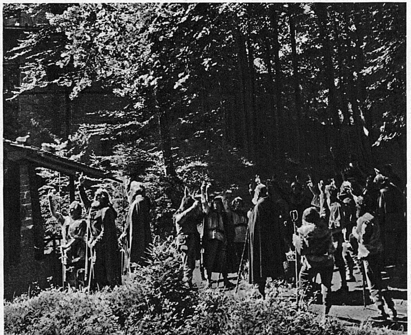
Der Rütli Schwur im Rugenpark zu Interlaken, dem schönen Schauplatz der Tell-Freilichtspiele – Le Serment du Rütli, une scène du Tell de Schiller qui se joue cet été à Interlaken

Das ehrwürdigste Dokument der Schweizergeschichte, der Bundesbrief von 1291, wird in Schwyz aufbewahrt. Am 2. August wird er in das neue Archiv übergeführt. Das Fest der Einweihung beginnt am Bundesfeiertag mit der Aufführung des Festspiels von Paul Styger auf dem Rathausplatz. Zu den Anfängen unseres Staatswesens führt uns auch die Tell-Dichtung Schillers zurück. Die allsonntäglichen Tellfreilichtspiele in Interlaken beginnen am 12. Juli und dauern bis Mitte September. Wie aus toggenburgischer Schenkung das Johanniterordenshaus Bubikon im Zürcher Oberland erblühte, und wie zur Zeit der Reformation Zürich das Erbe übernahm, zeigt uns das «Kreuzritterspiel» von Jakob Hauser, das an den Sonntagen von Mitte Juli bis Mitte August (mit Ausnahme des Turnfestsonntags) in dem prächtigen Burghof zu Bubikon zur Aufführung gelangt.