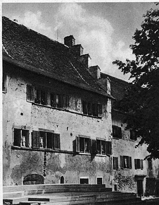
Das Ritterhaus in Bubikon von der Hofseite aus. Im Vordergrund sieht man die Bühne für das Kreuzritterspiel. Die ganze Hofanlage ist für eine solche Darbietung besonders geeignet – La scène du