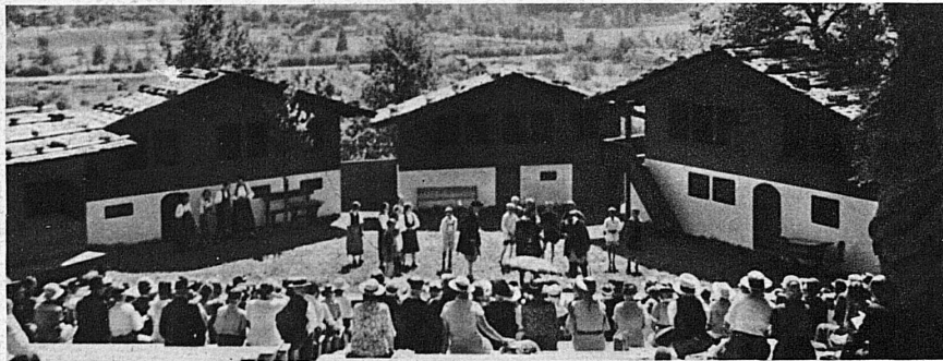
Die schöne Freilicht-Naturbühne bei der Ruine Resti in Meiringen. Eine Szene aus dem letztjährigen Spiel «En niwwi Zyt». – Théâtre alpestre de Meiringen