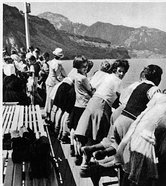
Mitten ins Bergland der Urschweiz auf dem windumspielten Deck — La croisière entre les montagnes