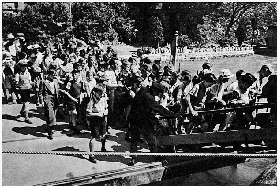
Nach dem Besuch der Telskapelle zurück auf das Schiff — Une visite à la chapelle de Tell et l'on se rembarque