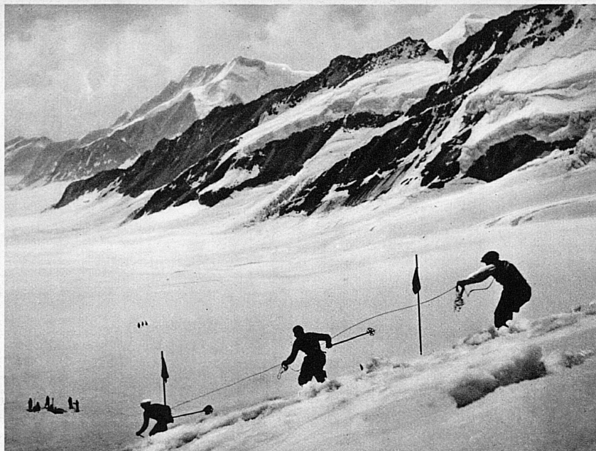
Seilfahren am Sommer-Skiennen auf Jungfrauoch — Ski à la corde au Jungfrauoch

Auf 3500 Meter Höhe bewahrt sich auch im hohen Sommer noch ein skigerechter Schnee. Die Schweizer Skischule Jungfrauoch bleibt auch während der glühenden Hundstage in Betrieb. Herrlich dehnt sich zwischen Berghaus und Konkordiaplatz das weite Abfahrtsgebiet. Hier führt die Schweiz alljährlich ihren Gästen mitten im Juli in einem einzigartigen Schauspiel die Freuden des Wintersports vor Augen. Dieses Jahr gelangt das Sommer-Skiennen am Jungfrauoch den 11. und 12. Juli zur Durchführung. Die Konkurrenzen — Abfahrtsrennen und Slalom für Damen und Herren am Samstag, Sprunglauf und Gruppenfahren am Seil am Sonntag — werden nach der internationalen Wettlaufordnung ausgetragen. Nicht nur die besten Schweizer, auch die bedeutendsten Skifahrer Deutschlands, Oesterreichs und Frankreichs messen sich auf dem ewigen Schnee. Das Sommer-Diavolezza-Abfahrtsrennen in Pontresina findet am 19. Juli, Abfahrtsrennen und Slalom auf dem Paneyrossaz-Gletscher bei Anzeindaz am 5. Juli statt.