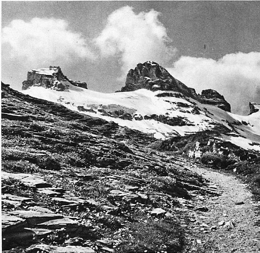
Le Jochpass - Am Jochpass bei Engelberg