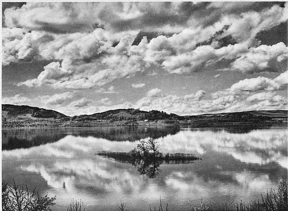
Ciel d'été sur le lac de Zoug - Sommertag am Zugersee

de séjour, chauffage, éclairage et musique. Très avantageux et pratique pour les automobilistes.