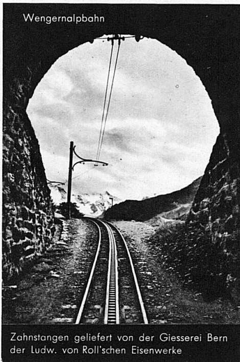
Zahnstangen geliefert von der Giesserei Bern der Ludw. von Roll'schen Eisenwerke

Walzwerke • Schmiede • Giessereien • Elektrostahlwerk • Mech. Werkstätten