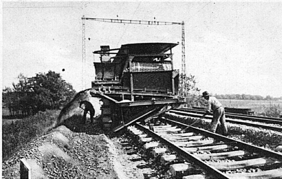
Machine à dégarnir et cribler le ballast des voies de chemins de fer

Syst. Scheuchzer Maschine zum Jäten, Aufhacken und Auflockern des Schotter der Eisenbahnlinien