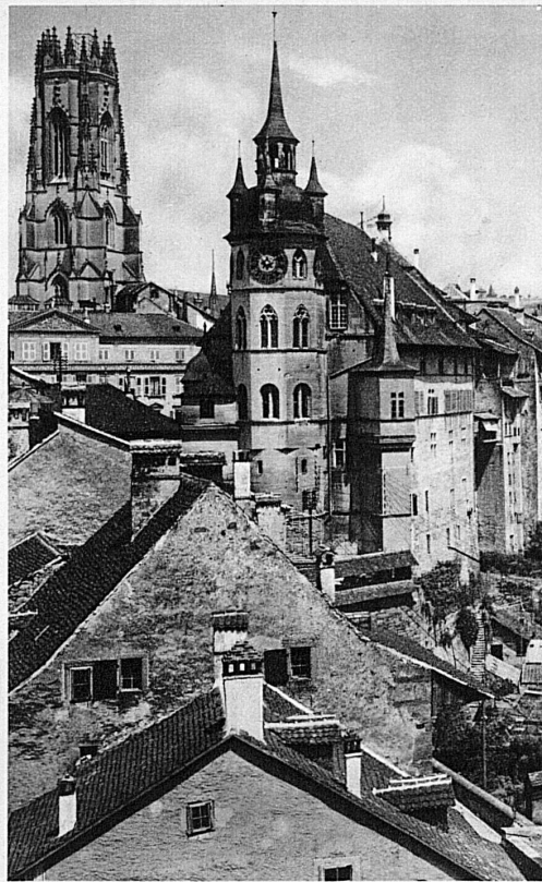
Freiburg: Tour de Bourguillon, Münster, Rathaus und Altstadt Freiburg: Tour de Bourguillon, Cathédrale et Hôtel-de-Ville