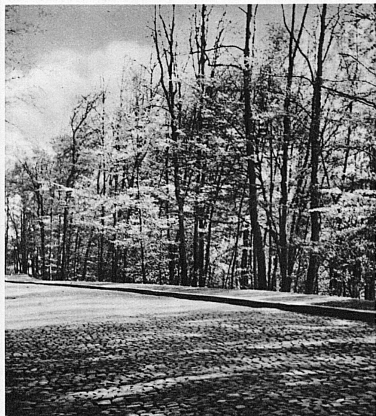
La route du Sihlwald — Im Sihlwald