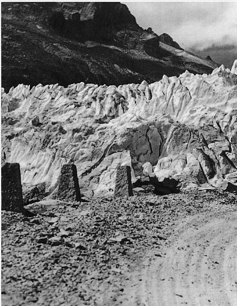
Au Glacier du Rhône — Am Rhonegletscher