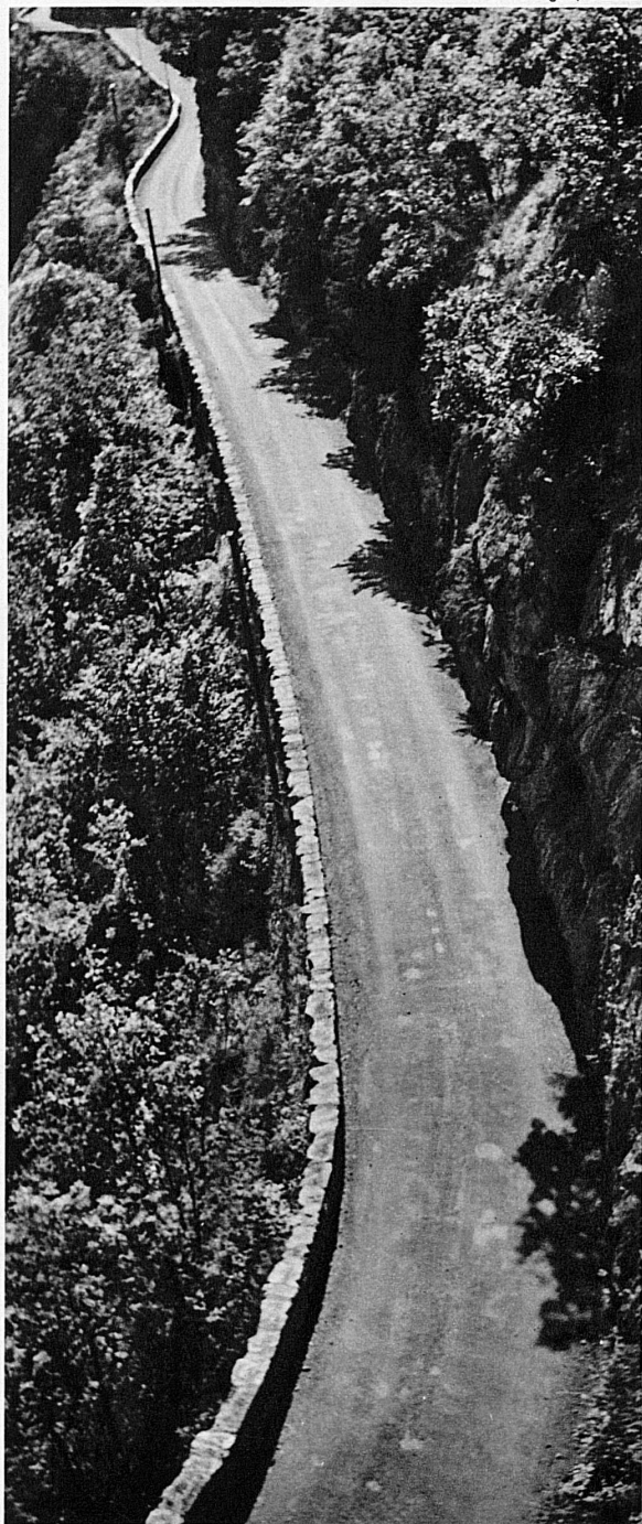
Sur le Col du Pillon – Pillonpass

Fatiguée d'un long trajet, de trop de spectacles admirés, de trop de paysages émouvants, la route se presse vers les demeures et le contact des hommes, vers la porte de la cité, dans les rues de laquelle brasillent entre les pierres des constellations artificielles.