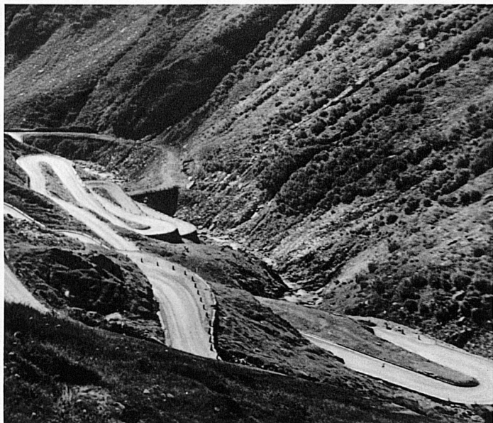
Les lacets du Val Tremola – In der Tremola

La route est une ligne mélodique, une danse qu'il suffit au voyageur d'orchestrer. Libre sous le ciel, elle inscrit sur la terre le paraphe d'une chorégraphie idéale. A elle seule elle caractérise un paysage par ses envols, ses rampes et ses pentes. Qui confondrait une route de Suisse avec celles qui traversent les plaines de la Beauce française ?