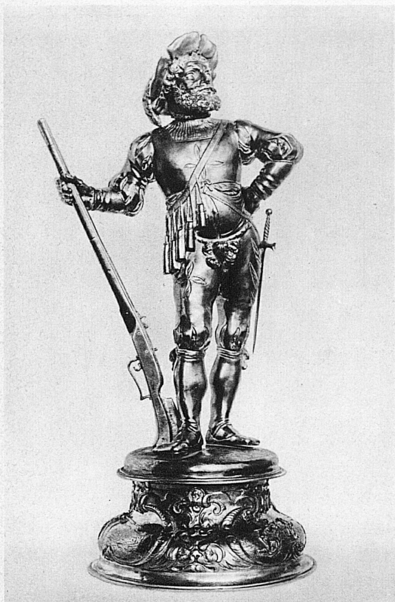
Büchenschütze, als Tafelaufsatz. Arbeit des Zürcher Goldschmieds Hans Jakob Holzhalb, 1646 – Arque-

Für die Kunst der ganzen Welt besitzt die Schweiz Interesse und Aufnahmefähigkeit. Das beweisen die vielen grossen Ausstellungen in schweizerischen Städten, wo klassische, moderne, exotische Kunst der verschiedensten Länder in abwechslungsreicher Folge gezeigt wird. Sollte die Schweiz nicht auch einmal für den Glanz und Reichtum ihrer eigenen Kunst werben dürfen? Das Kunstschaffen der Schweiz ist im Ausland längst nicht so bekannt wie die landschaftlichen Schönheiten und die industriellen Leistungen unseres Landes. Auch der Schweizer selbst weiss es noch viel zu wenig, was für bedeutende Baudenkmäler und Kunstschätze sein Land besitzt. Nun wird der 14. Internationale Kunsthistorische Kongress, der vom 31. August bis zum 9. September in der Schweiz tagt, Gelegenheit geben, in einer gross angelegten Manifestation den Kunstbesitz unseres Landes zur Geltung zu bringen. Die grosse Kongressgemeinde wird sich in einer ganzen Reihe von Städten aufhalten und unterwegs die bedeutendsten Kunststätten und historischen Baudenkmäler in der Landschaft der deutschen und welschen Schweiz besichtigen. Auch schweizerische Kunstfreunde sind als Kongressteilnehmer sehr willkommen. Das Sekretariat ist in Basel (Elisabethenstrasse 27).