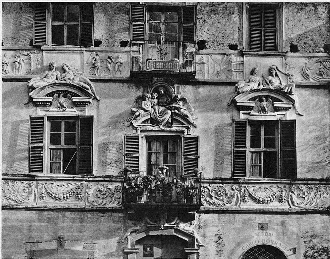
Die Fassade der Casa Borroni in Ascona (Tessin) – Façade Renaissance de la Casa Borroni à Ascona