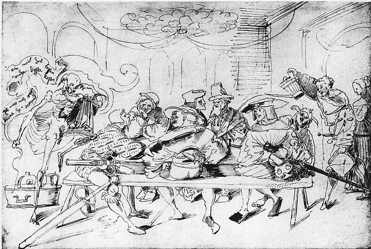
Urs Graf: La Mort à la taverne. Le soudard suisse attablé entre des lansquenets allemand et français (Cab. est., Bâle) - Urs Graf: Der Tod in der Taverne. Schweizer Söldner zwischen einem deutschen Landsknecht und einem französ. Krieger (Kupferstichkabinett, Basel) - Urs Graf: Death in the Inn. The Swiss mercenary at table with German and French hinds (Copper Engraving Collection, Basle) - Urs Graf: La Morte nella taverna. Mercenario svizzero fra un lanzicheneco e un guerriero francese (Cabinetto delle incisioni in rame, Basilea)