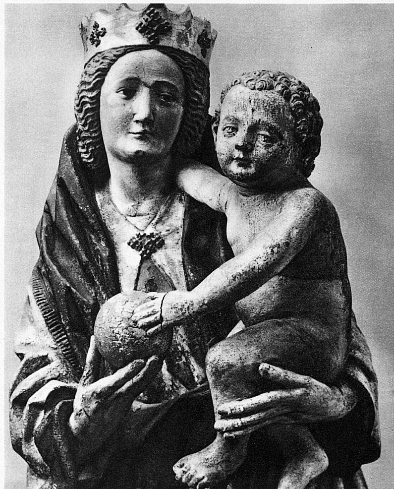
Mutter Gottes aus dem st. gallischen Rheintal. Hans Multscher in Ulm nahestehend. 2. Viertel des 15. Jahrhunderts – Vierge du Rheintal st-gallois, dans la manière de Hans Multscher d'Ulm, 2 me quart du XV me siècle – Madonna from the Rhine Valley (St. Gall). Similar style to that of Hans Multscher in Ulm. 2nd quarter of 15th century – La Vergine (Vallata del Reno nel Cantone di San Gallo), apparte-

Wir stellen daneben noch ein weiteres Zeugnis weltlicher Kunst: Die Grabplatte Ulrichs von Regensburg, † um 1280. Was der Künstler — auch er ein namenloser — uns zeigt, ist nicht wie im eben betrachteten Marmorrelief ein idealisiertes Porträt lebendiger Einzelpersönlichkeit, sondern das aufs höchste gesteigerte Sinnbild einer ganzen Gesellschaftsschicht — des Rittertums schlechthin. Dass es just in einer Zeit entstand, da sich schon unaufhaltsam der Verfall ritterlicher Kultur vollzog, macht es dem Wissenden doppelt eindrucksvoll. So ist es eine von innen her grundverschiedene Einstellung zur Aufgabe der Menschenschilderung, was hier das 13. und das 16. Jahrhundert, den Norden und den Süden eindeutig voneinander scheidet. I. B.