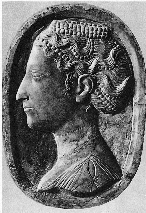
Marmormedaillon von der Casa Rusca in Locarno. Gegen 1500 — Médaillon de marbre de la casa Rusca à Locarno, vers 1500 — Marble medaillon from the Casa Rusca in Locarno. About 1500 — Medaglione in marmo della Casa Rusca a Locarno. Del 1500 circa