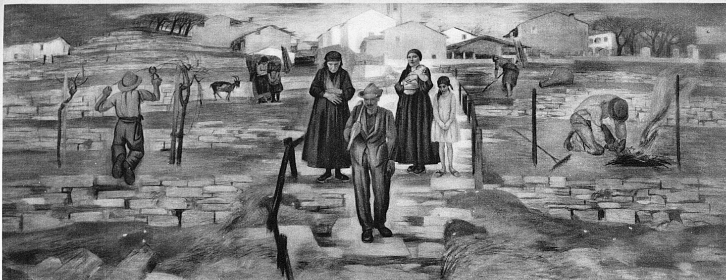
Les émigrants. Peinture murale dans la gare de Chiasso, de Pietro Chiesa