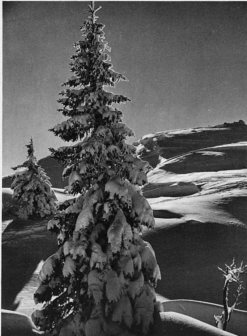
Im Gebiet des Lac de Joux