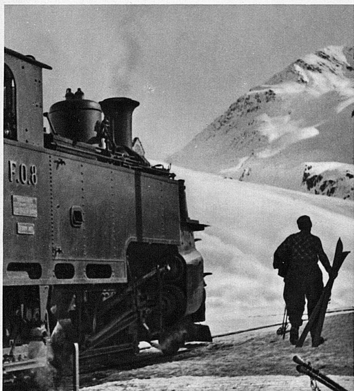
Die Furka-Oberalpbahn im Dienste des Wintersports

Von vier Seiten führt der Schienenweg tief in die Gotthard-Skigebiete hinein. Von Norden über Luzern nach Göschenen und von da durch die Schöllenen nach Andermatt, von Süden in die obere Leventina nach Ambri-Piotta, Airolo und zum Eingang des Bedrettotals, von Westen hoch ins Goms bis Oberwald und im Osten in das schneereiche bündnerische Tavetsch mit seinen stillen Dörfern Sedrun und Tschamutt. Die Furka-Oberalpbahn, die im Sommer über die Pässe hinweg das Wallis mit Graubünden, Zermatt mit St. Moritz verbindet, hält im Winter in der Mitte ihrer Strecke, zwischen Andermatt und Nätschen, den Betrieb aufrecht.