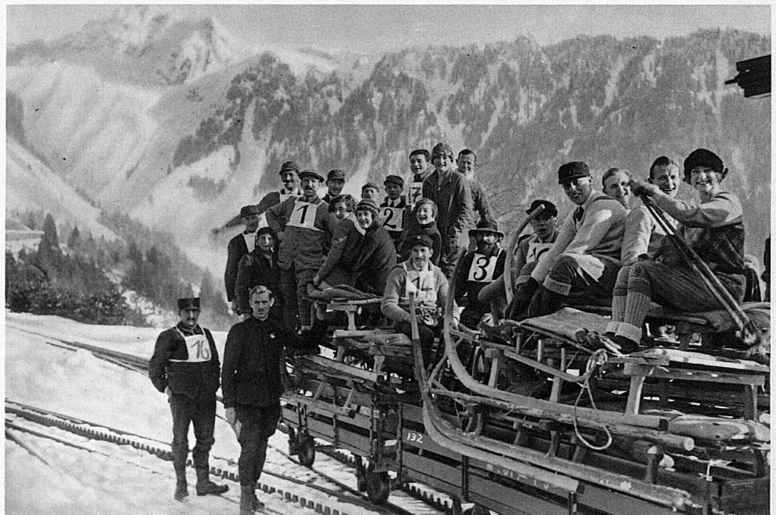
Ein lustiges altes Bild von dem traditionellen Heuschlittenrennen in Caux

trouvez encore suspendue la luge de bois qui leur servait à voiturier foin et bois sur l'immense toboggan qui tombe de la Dent de Jaman au lac. Un traîneau primitif, sans ferrures, terminé par deux puissantes cornes qui servent à le conduire. A la montée l'homme le porte simplement sur la tête. Puis quand il a lié dessus l'énorme filet à foin ou sa charge de bois, empoignant les cornes et arcbuté en arrière, il se laisse entraîner sur la pente en jouant des talons. Son labeur achevé, le traîneau, de son vrai nom patois la gaîtze, devient en hiver un engin de plaisir où s'entassent filles et garçons pour devaler par les chemins glacés en chantant, conduits par le fort de la bande. De là à en faire un engin de concours, c'est un pas que les hôtes d'hiver de Caux eurent bientôt fait. Et c'est ainsi que chaque année les vieilles