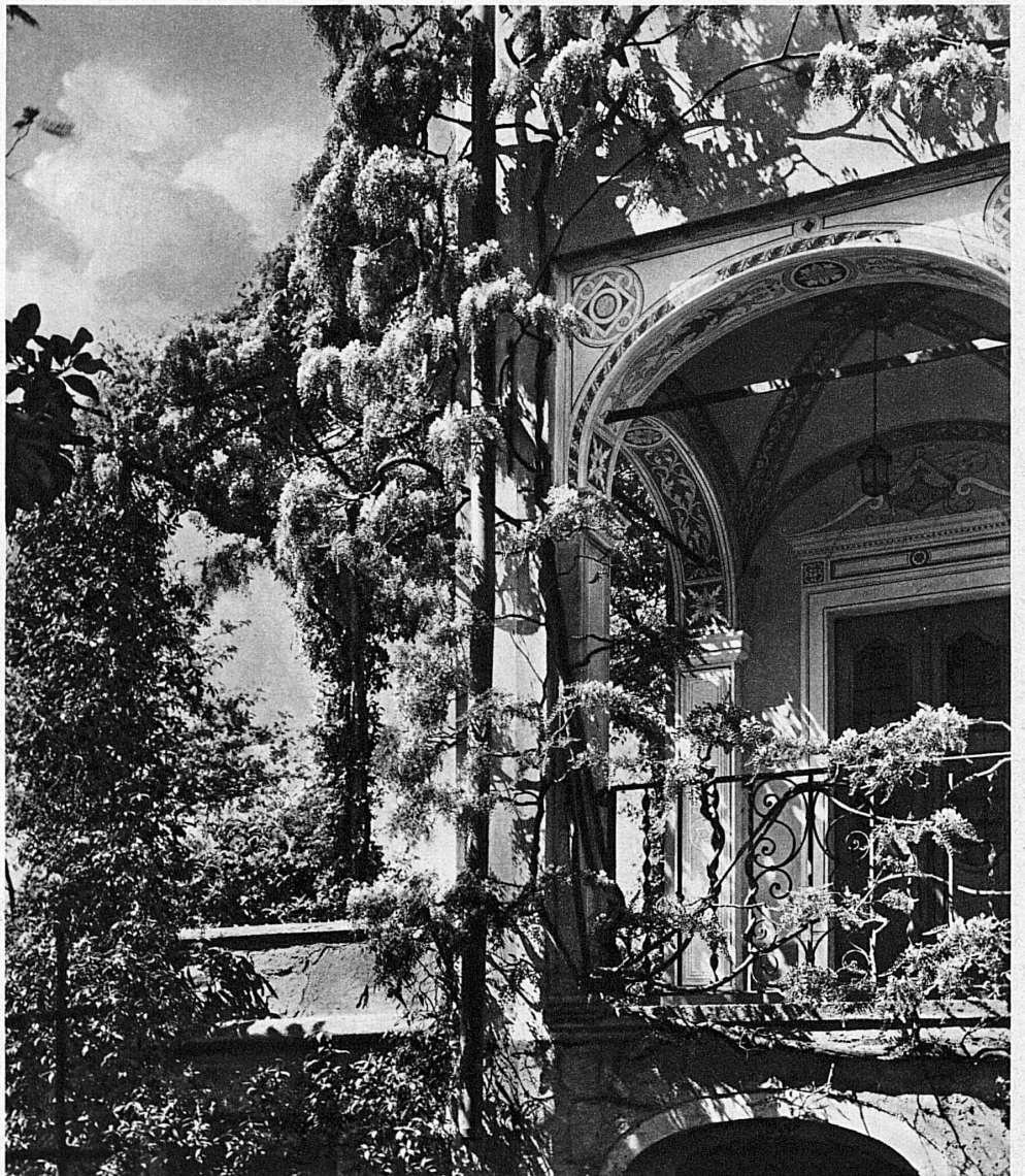
Glycines en fleurs à Locarno – Glyzinenblüte bei Locarno