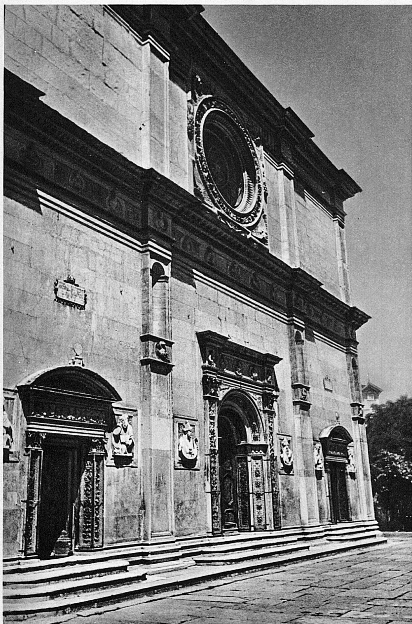
Façade Renaissance de la Cathédrale de Lugano – Die Renaissancefassade der Kathedrale von Lugano

vous trouverez le séchoir à châtaignes, les marrons empilés sur une claie de ramures de châtaignier, tenue par une poutre de châtaignier, sous laquelle fume un bourrin de châtaignier. Dans la cuisine, le banc est encore une fourche de châtaignier auprès de laquelle vous remarquerez le maître-rondin de châtaignier entamé, que l'on met au feu à la Noël ou bien les jours de maladie. Et c'est entre quatre ais de châtaignier encore que les morts s'en vont aux petits cimetières et dormiront sous une croix du même bois au pied des campaniles. Le châtaignier est ici véritablement l'arbre de la Vie et de la Mort.