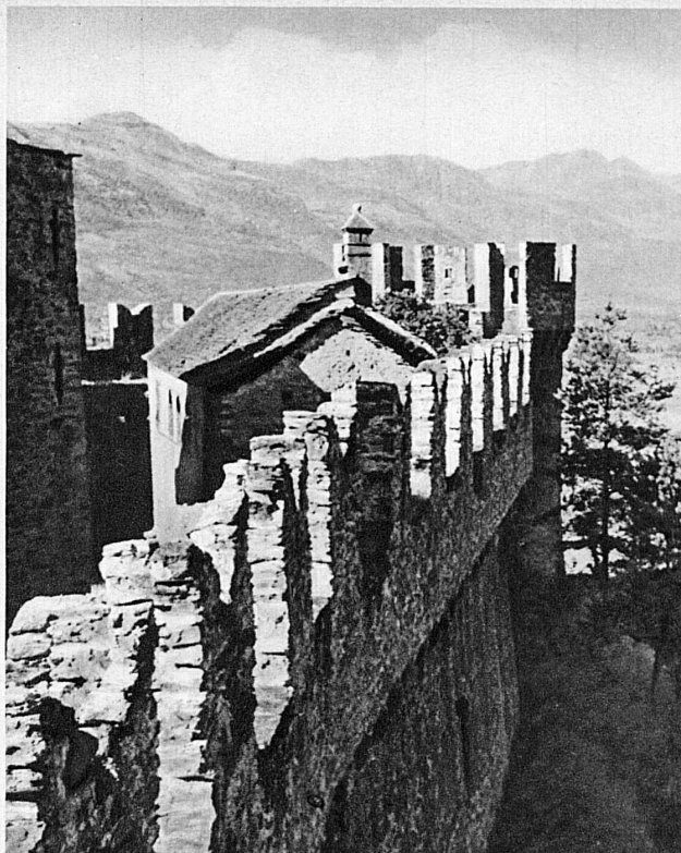
Créneaux du Château-fort de Schwyz à Bellinzona – Die Zinnen der festen Burg Schwyz in Bellinzona