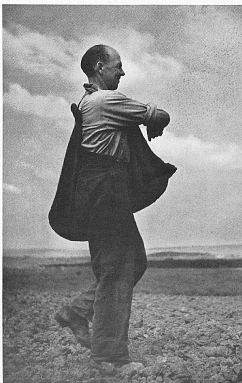
Zwischen Saat und Ernte liegt das grosse Bauernjahr mit seinen Hoffnungen, seiner Arbeit und seiner Sorge.

Nicht die Milde des Himmels und die Freigebigkeit der Erde allein wecken die Liebe zur Scholle, jene dankbare, durch die Geschlechter fortgeerbte Treue. Je härter der Kampf mit der Natur ist, desto tiefer scheint vielmehr die Heimatliebe eines Volkes zu wurzeln, so, wie die innigste Bindung zwischen zwei Menschen sich in der Wirklichkeit des Alltages erprobt und zum unverbrüchlichen Treueverhältnis wird. Die Schweizer Geschichte, mehr aber noch die Geschichte der Familien und der Gemeinden, geben einen tiefen Einblick in die Anhänglichkeit an das Land, das in seinen Gaben so gar nicht üppig und verschwenderisch ist.