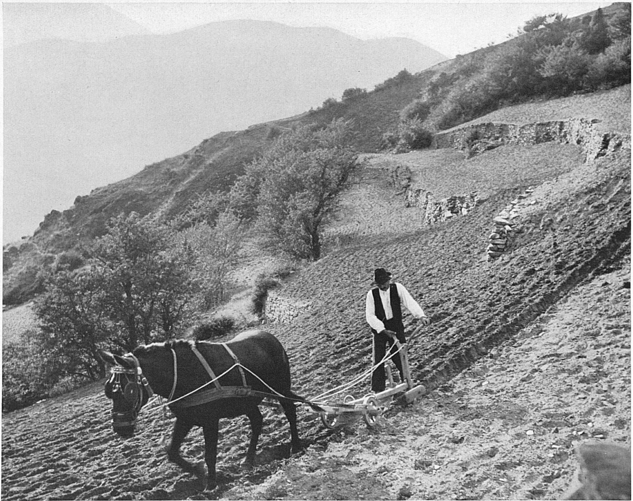
Hart ist die Ackerarbeit in den Bergen und doch wird für den Eigenbedarf hoch oben an den Talhängen noch Getreide angebaut. Walliser Bauer in Visperterminen (1320 m ü. M.) mit seinem Holzpflug