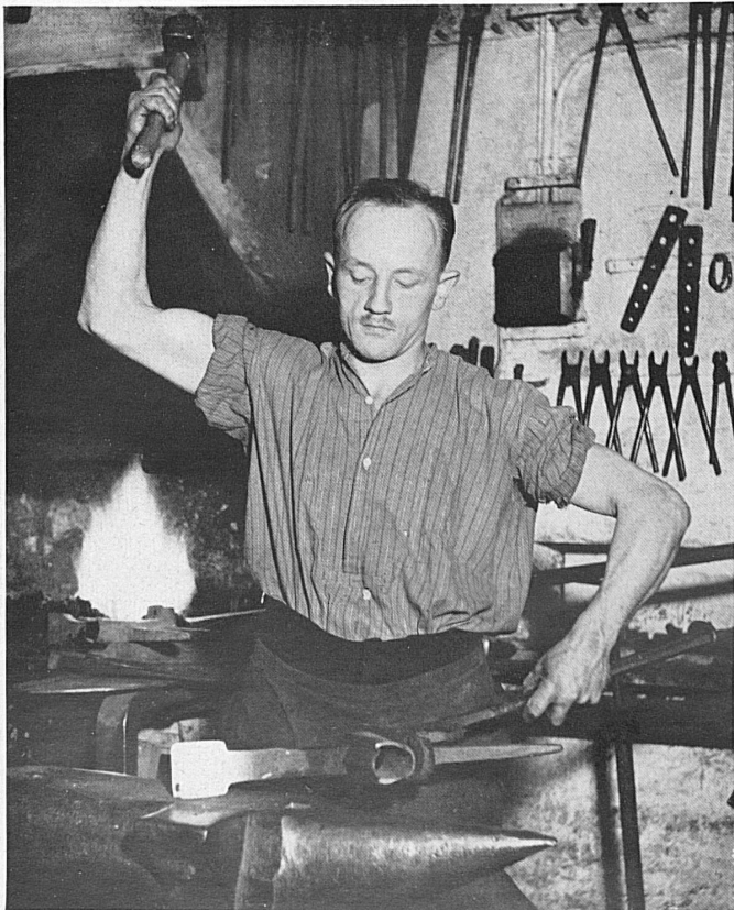
Das Schweizervolk ist nicht mehr vorwiegend ein Bauernvolk. Zu den grossen Stammkräften der Nation gehören neben dem Bauernstand die Arbeiterschaft und das Handwerkertum