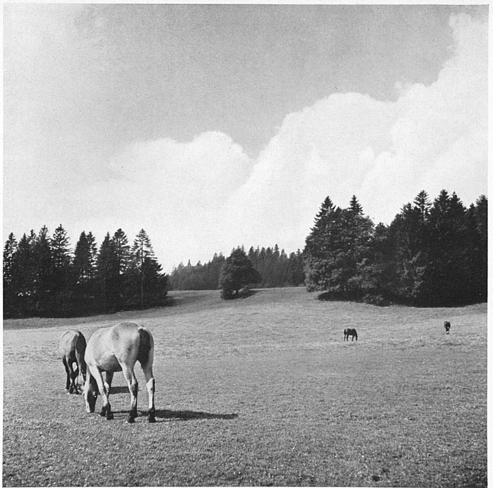
Die jurassische Höhenlandschaft mit ihren feierlichen parkartigen Tannengruppen, ihren stillen Pferdeweidern, ihrem grossgewölbten Himmel ist von eigenartig starkem Reiz. Die Freiberge im Berner Jura sind das bedeutendste Schweizer Pferdezuchtgebiet

Die Landesausstellung in Zürich will dem Schweizervolk und den fremden Gästen ein lebendiges Bild der Schweiz und ihrer Leistungen auf allen Gebieten vermitteln. Diese Leistungen sollen, gleichsam von innen heraus, als Werke eines unermüdlich ringenden, arbeitsamen und freien Volkes verstanden werden, nicht