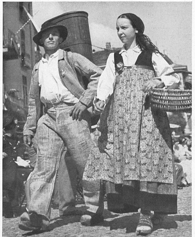
Die Zugehörigkeit von vier Sprachstämmen zur Eidgenossenschaft hat vor allem die Mannigfaltigkeit schweizerischer Volkstypen geprägt. Tessiner am Kamelienfest in Locarno