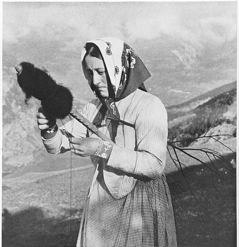
Walliser Frau in Visperterminen, die heute noch, wie wohl schon vor tausend Jahren, beim Viehhüten auf dem Felde mit dem Rocken den Wollertrag ihrer Schafe spinnt