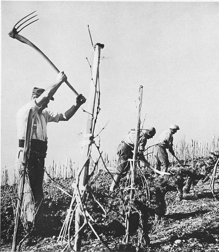
Frühlingsarbeit waadtländischer Weinbauern an den Uferhängen des Genfersees in der französischen Schweiz

nur als Resultate einer vervollkommenen Organisation und eines unpersönlichen allmächtigen Staates. Um den Besucher dazu anzuleiten, alles, was die Ausstellung zeigt, zum Menschen in Beziehung zu setzen, führt ihn der Rundgang zuallererst auf der « Höhenstrasse » durch die Abteilung « Heimat und Volk ». Mit dem schweizerischen Menschen und seiner Erde, mit all seinen Lebensbedingungen wird er also zuerst vertraut gemacht. Auf den naturgegebenen Grundlagen sieht er die sozialen und politischen Formen des Gemeinschaftslebens entstehen. Die besondere Eigenart des föderalistischen Staates, das Eigenleben und das fruchtbare Zusammenwirken der vier Volks- und Sprachgruppen und der 25 Kantone wird ihm verständlich. Das Schicksal der Schweizer, die fern der Heimat leben, wird ihm zum Erlebnis. Als ein grosses, erläuterndes Vorwort zu der ganzen Ausstellung ist so diese erste Abteilung gedacht.