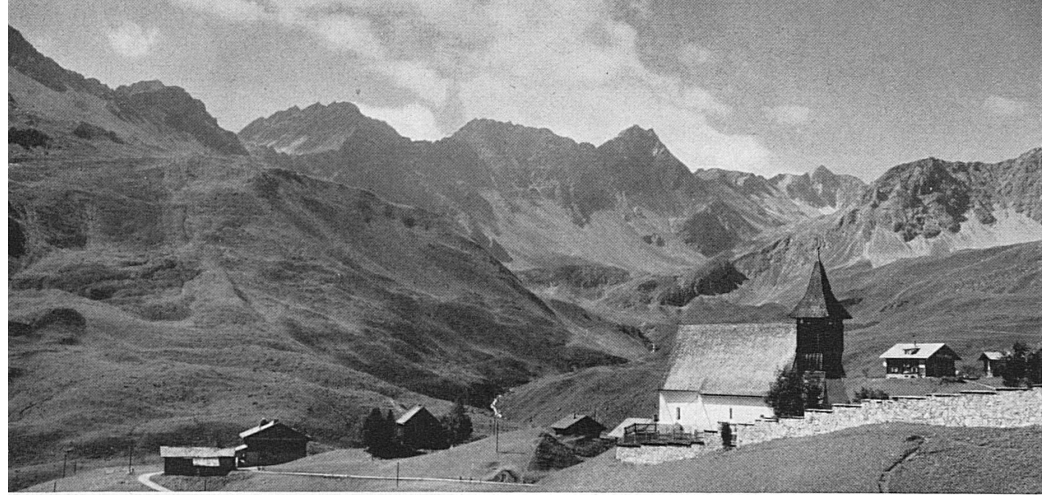
Oben: Das idyllische Bergkirchlein im Alpengebiet von Innerarosa in Graubünden. Darunter: Am Naturstrand von Yverdon am Neuenburgersee