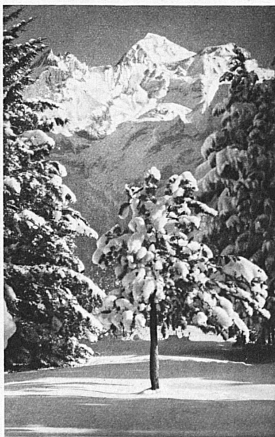
Kandersteg (Oberland bernese — Oberland bernois — Bernese Oberland)