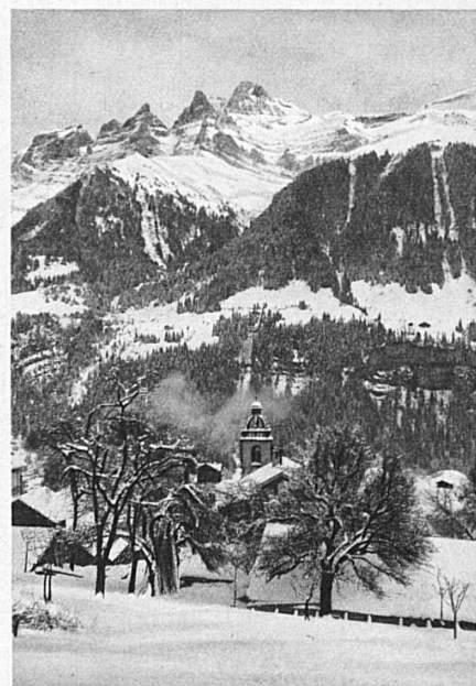
Champéry (Vallese — Valais)

Oggi non v'è più persona, a qualunque ceto appartenga, che non sia convinta degli effetti salutari delle vacanze invernali. La passione degli sport invernali, fonte di energia e di piacere, ha oramai conquistato il mondo. In nessun periodo dell'anno l'uomo sente il bisogno di muoversi a proprio agio nella luce e nel sole, come in inverno. Mai come in questa stagione si avverte l'enorme contrasto fra il clima del piano, avarissimo di sole, e l'atmosfera vivificante delle altitudini.