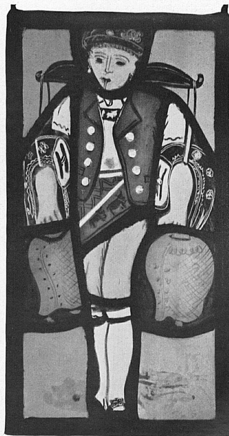
Glasscheiben, Malereien von Otto Staiger, Basel — Vitres en couleurs de Otto Staiger, Bâle