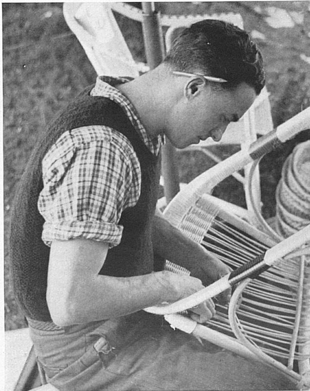
Travaux et fêtes du peuple tessinois