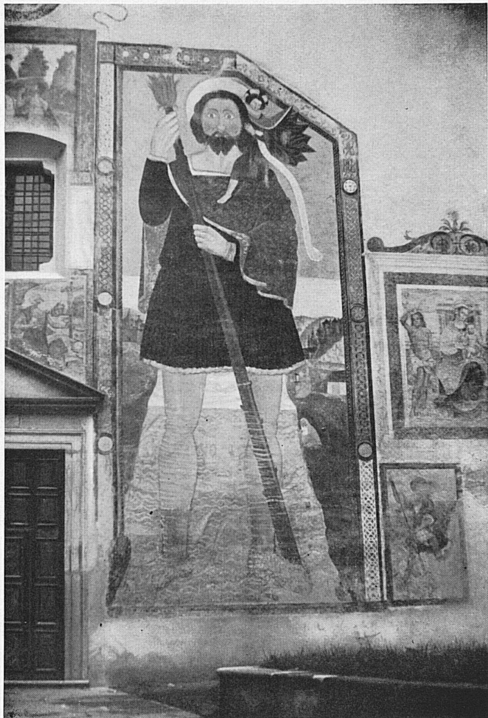
Le Saint Christophe de Malvaglia St. Christoph von Malvaglia St. Christopher at Malvaglia