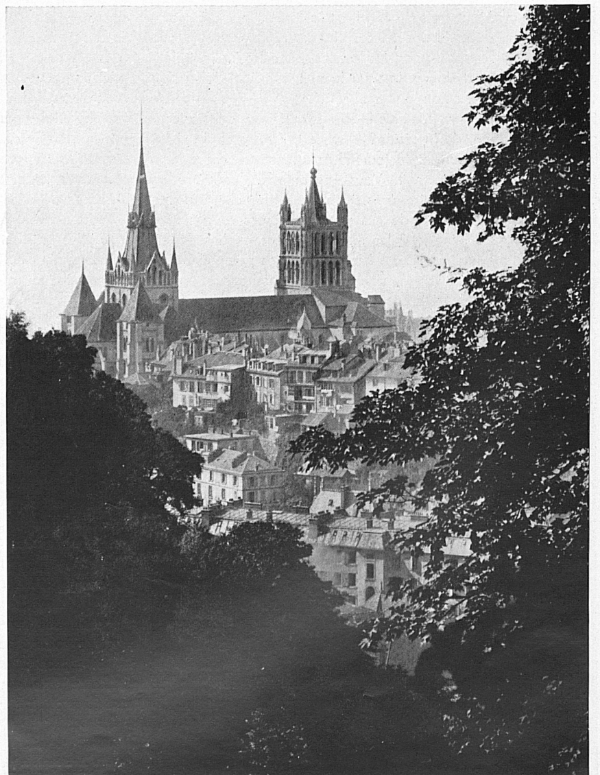
Die Kathedrale von Lausanne — La cathédrale de Lausanne — Lausanne Cathedral