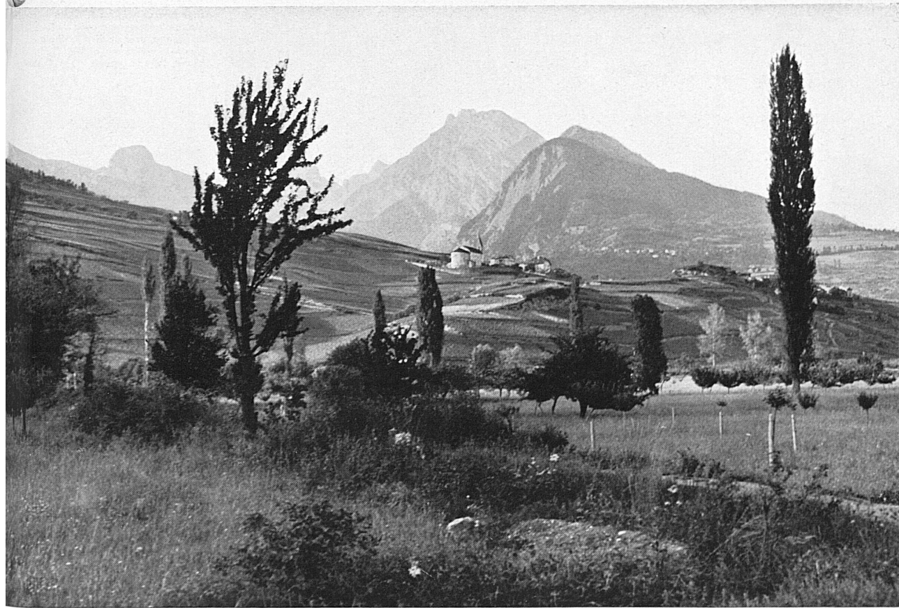
Conthey und das Rhonetal — Conthey (Valais) et la vallée du Rhône — Conthey and the Rhonevalley (Valais)