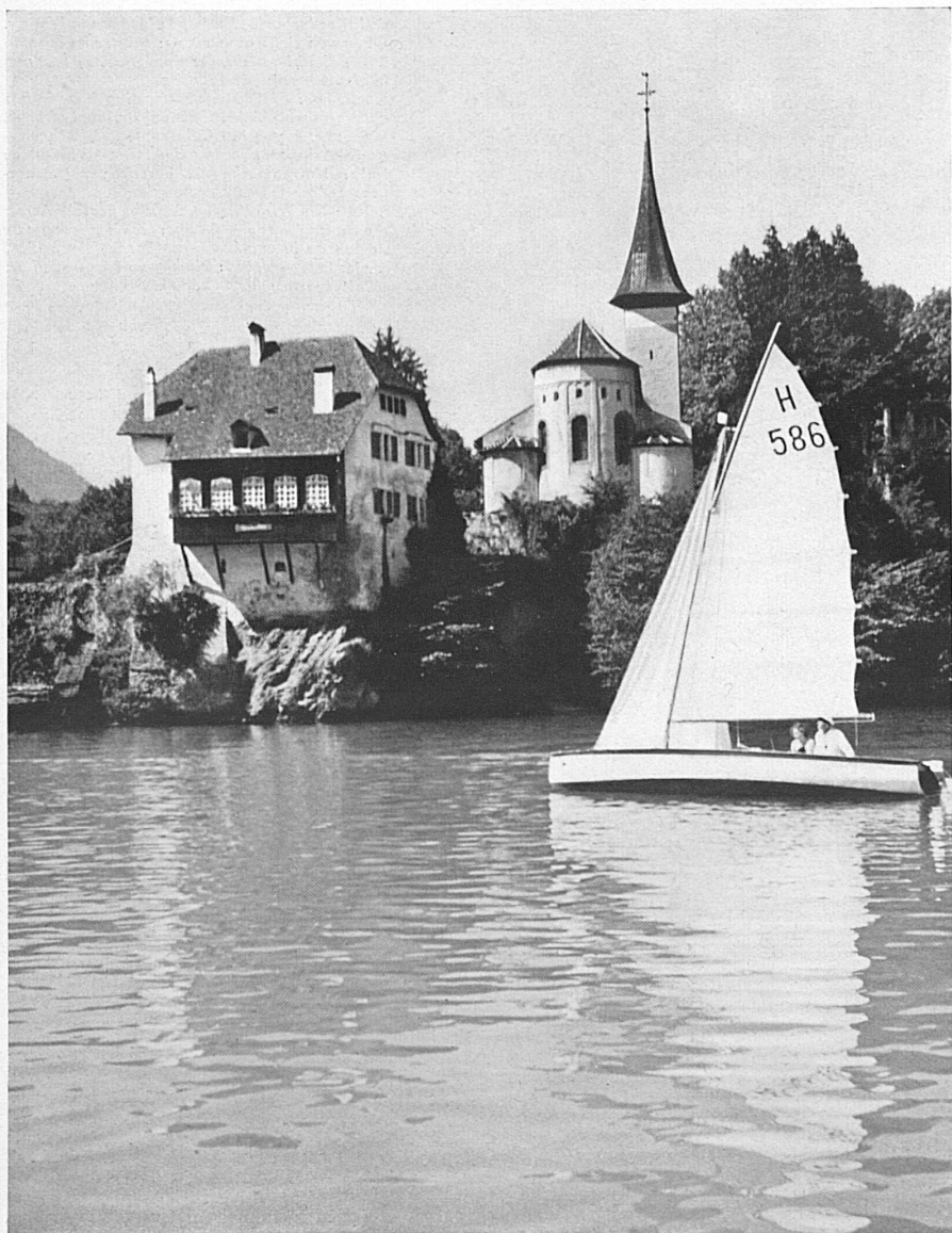
Die romanische Kirche von Spiez am Thunersee — L'église romane de Spiez aux bords du Lac de Thoune — Roman Church at Spiez on the Lake of Thun

Der Wanderer, der an solchen Tagen einem der Voralpen- oder Juragipfel einen Besuch abstattet, die zu Hunderten und Tausenden den Tälern und Seebecken entsteigen und die man die wahren Ob-