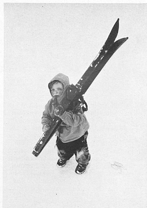
Sonniges Braunwald · Braunwald au soleil!