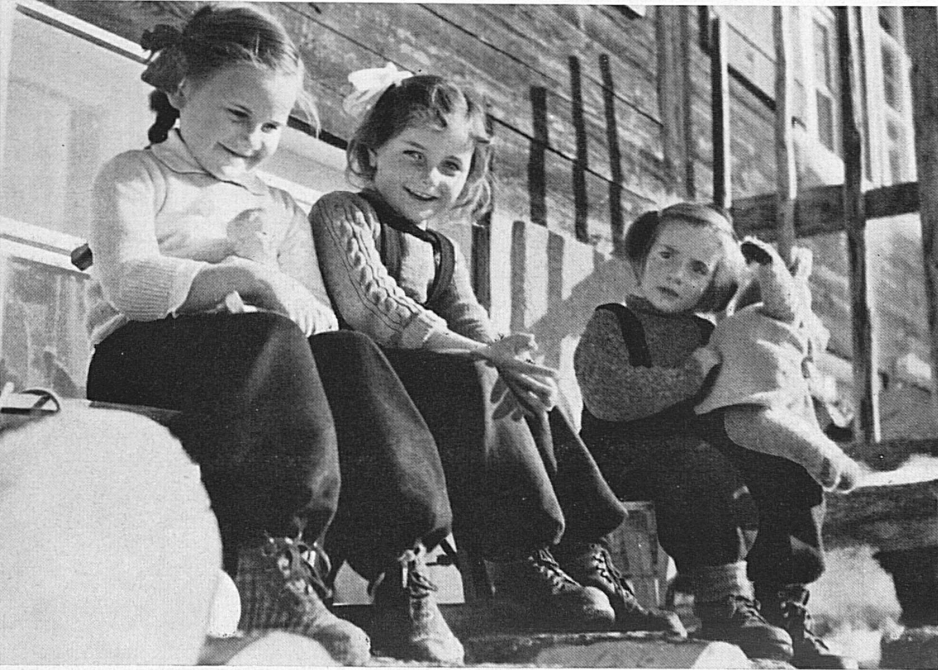
Links Mitte: Auf der sonnen- warmen Spältenbeige ruhen sich die kleinen Berner Ober- länderli von ihren Taten aus