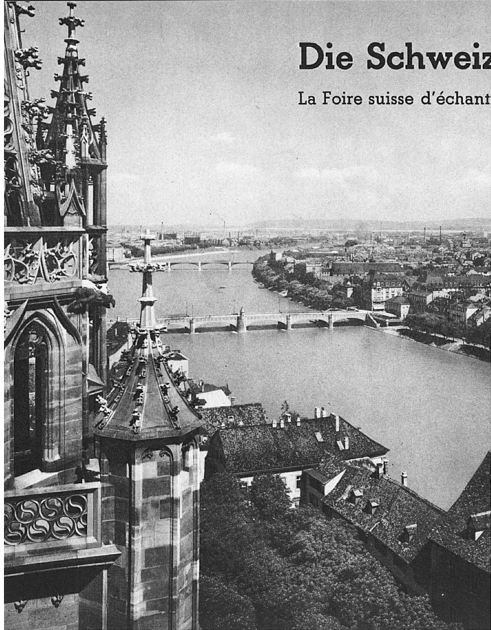
Blick vom Basler Münster auf den Rhein und die Industriequartiere — Vue sur le Rhin et les quartiers industriels de Bâle, prise de la Cathédrale — View from Basle Cathedral over the Rhine and industrial areas

La Foire suisse d'échantillons, rendez-vous des hommes