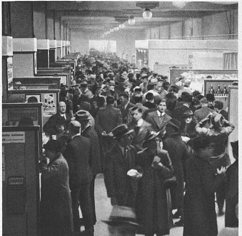
Hochbetrieb in den Messehallen — Les halles de la Foire en pleine activité — Crowded Halls of the Fair