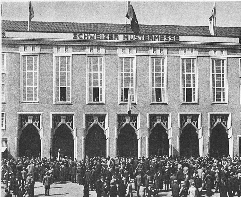
Eingang der Schweizer Mustermesse in Basel — Entrée de la Foire d'Echantillons de Bâle — Entrance to the Swiss Samples Fair in Basle

Wie die meisten europäischen Messen, so ist auch die Schweizer Mustermesse in der Not der Weltkriegsjahre geschaffen worden. Dem natürlichen Ausweitungsdrange der schweizerischen Wirtschaft wurden damals plötzliche und mächtige Schranken gesetzt. Der Aussenhandel erfuhr eine starke Schrumpfung, und zahlreiche Wirtschaftskräfte wurden brachgelegt. Die bisherigen 22 Messeveranstaltungen in Basel haben in hohem Masse dazu beigetragen, diese Kräfte zu sammeln und der hochentwickelten Industrie, sowie dem vielgestaltigen Gewerbe als teilweisen Ersatz für verlorengegangene Absatzmärkte zusätzliche Aufträge des Inlandes zuzuführen.