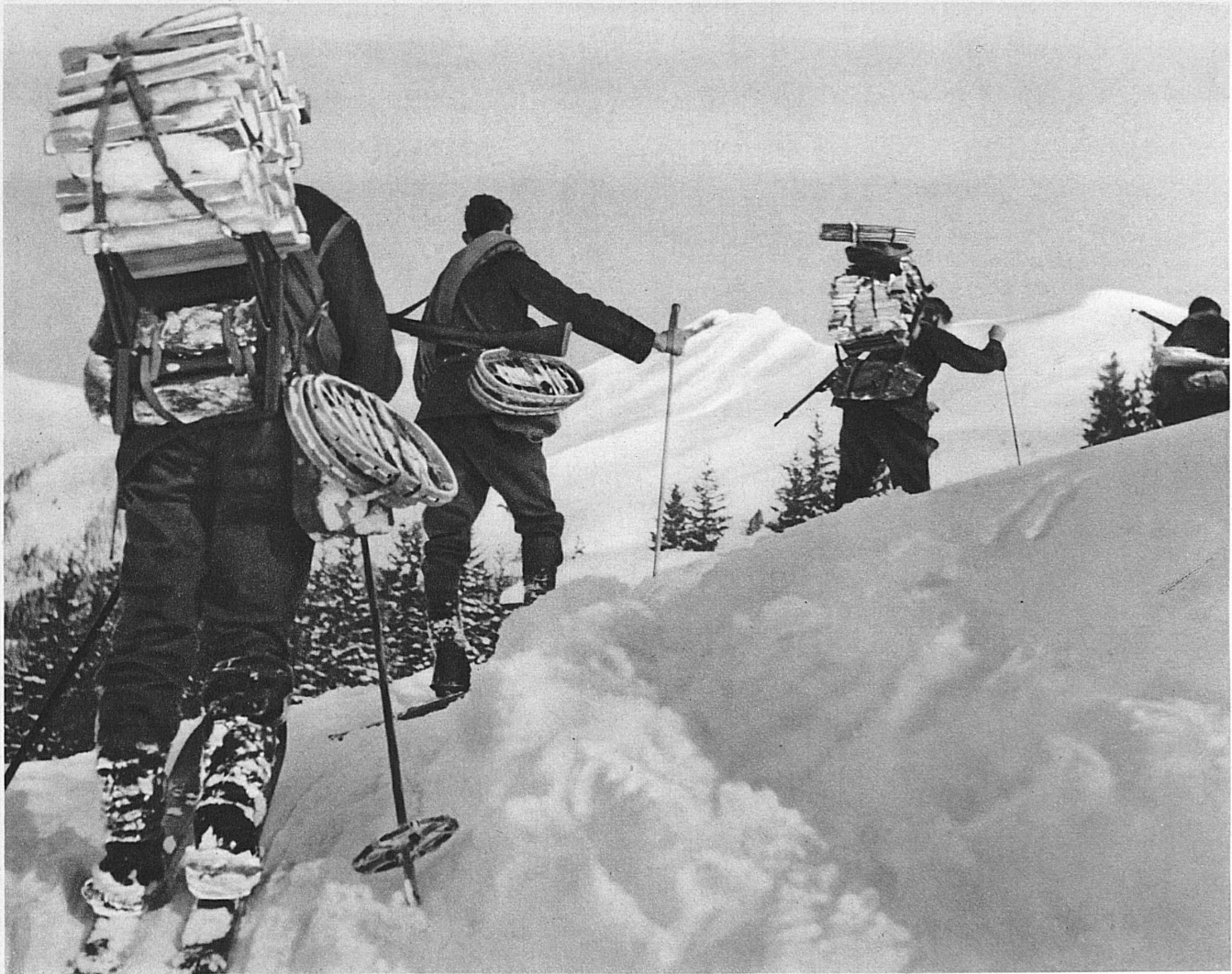
Auf dem Marsch zum Schnee-Biwak. Der einzelne Soldat trägt neben seiner persönlichen Ausrüstung eine Zeltblende, Wolldecken, Schneereifen-Steigeisen und Holz zum Kochen — Sur le chemin du bivouac. Les soldats portent chacun en plus de leur propre équipement une toile de tente, une couverture de laine, des raquettes à neige, des crampons et une provision de bois