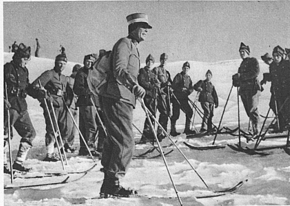
Appel vor dem Ausrücken — L'appel

Mit weissen Uniformüberzügen ausgerüstetes Spezialdetachment auf dem Marsche. Die Überzüge dienen zur Tarnung im Schneegelände — Détachement spécial dont l'uniforme est caché sous un costume de toile blanche en guise de camouflage