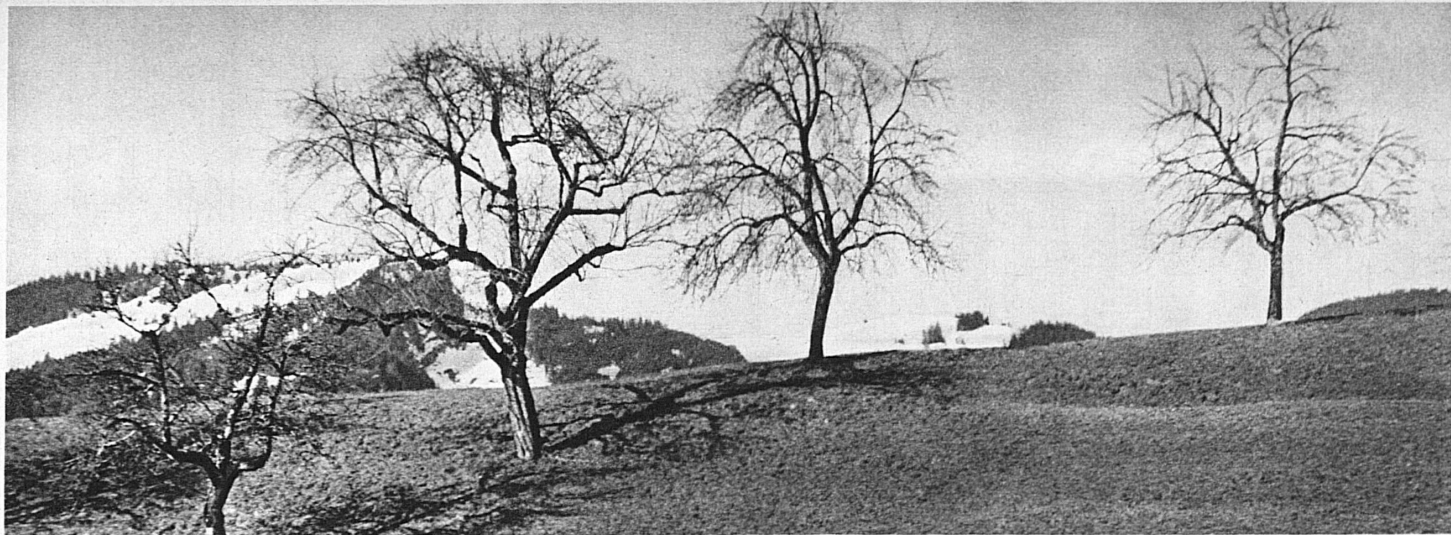
Einen wunderbaren Reiz hat der Vorfrühling in den Hügel- und Voralpengebieten der Schweiz. Märzstimmung in der Ostschweiz