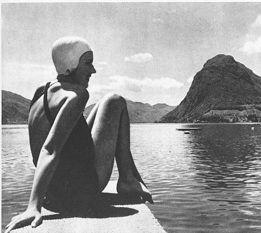
Früh beginnt an den Seen des Tessin die Badesaison. Im Lido von Lugano am Luganersee. Im Hintergrund der Monte San Salvatore