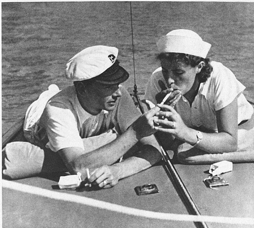
Früh beginnt am Thunersee der Betrieb der Segelschule, die in verschiedenen Uferkurorten stationiert ist