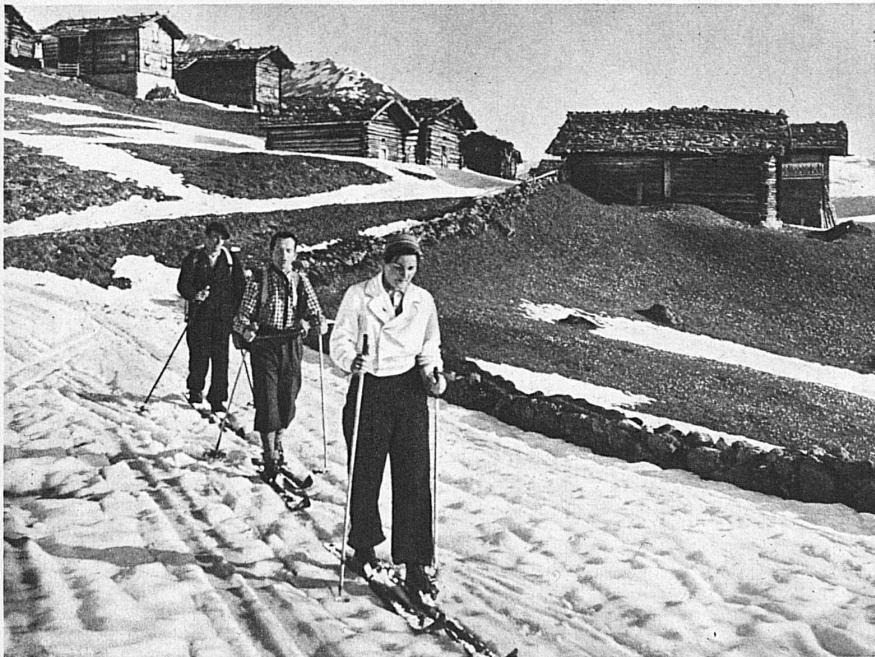
Abstieg von der Alp im Frühlingschnee