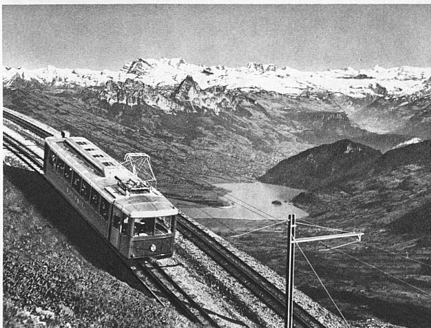
Die zahlreichen Bergbahnen ermöglichen, abwechslungsweise den Bergfrühling und den Seenfrühling zu geniessen. Die Rigibahn in der Zentralschweiz

Der Gegensätze ... denn der Mensch, der die blühenden Gebiete durchwandert, braucht nur das Auge zu erheben, und wieder leuchten ihm die Firne der Hochalpen entgegen; er braucht nur eine der vielen Bergbahnen zu besteigen, um dieses unvergessliche dramatische Erlebnis zu finden: die Gleichzeitigkeit der Jahreszeiten, den unvergleichlichen Wechsel von Schnee und Blütenpracht, winterlicher Herbe und frühlingshafter Milde im Bild der schweizerischen Frühlingslandschaft.