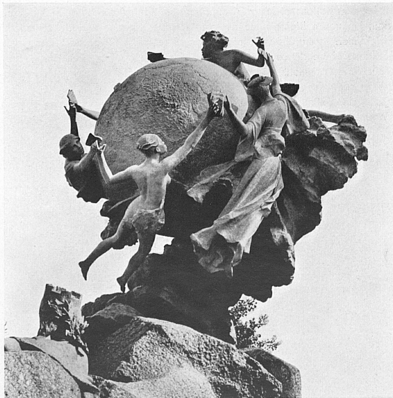
Le monument de l'Union postale internationale à Berne