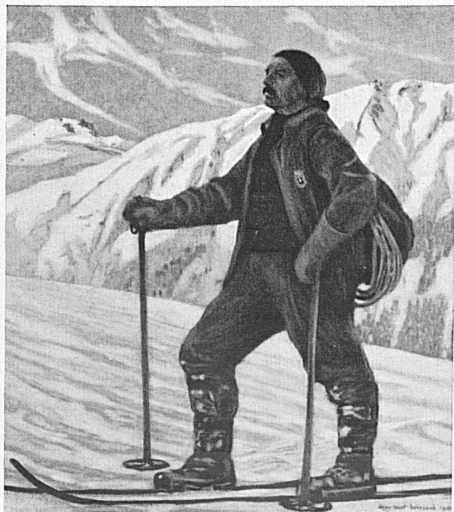
Karte aus der Serie Pro Infirmis von Hans Beat Wieland