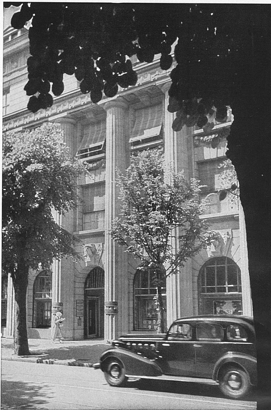
Eingang zum Bankgebäude in Zürich