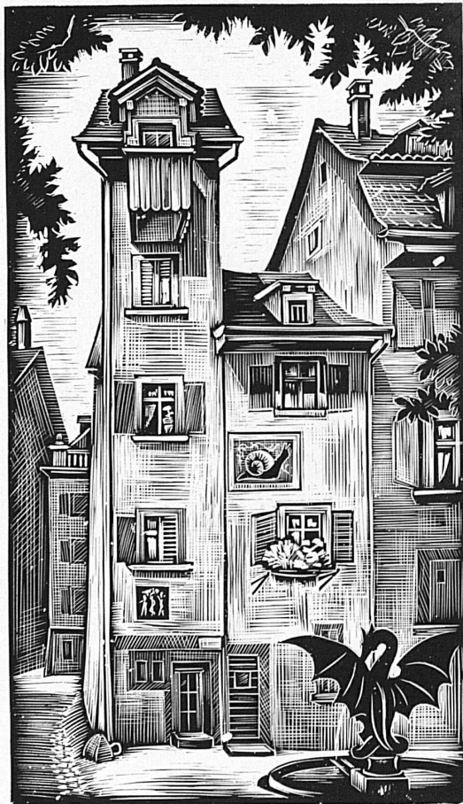
Originalholzschnitte von Joh. Aug. Hagmann