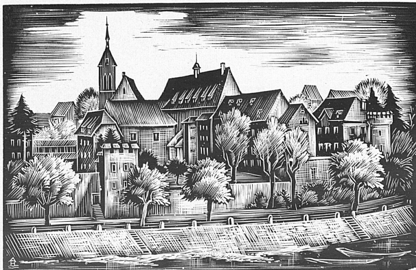
Das anfangs des 15. Jahrhunderts entstandene Karthäuserkloster am Rhein in Kleinbasel — Chartreuse du 15 me siècle dans le Petit-Bâle, aujourd'hui un orphelinat

Das alte Haus ist seinem Bewohner ein treuer und verschwiegener Freund, bei dem er immer gute Zuflucht findet. Seine